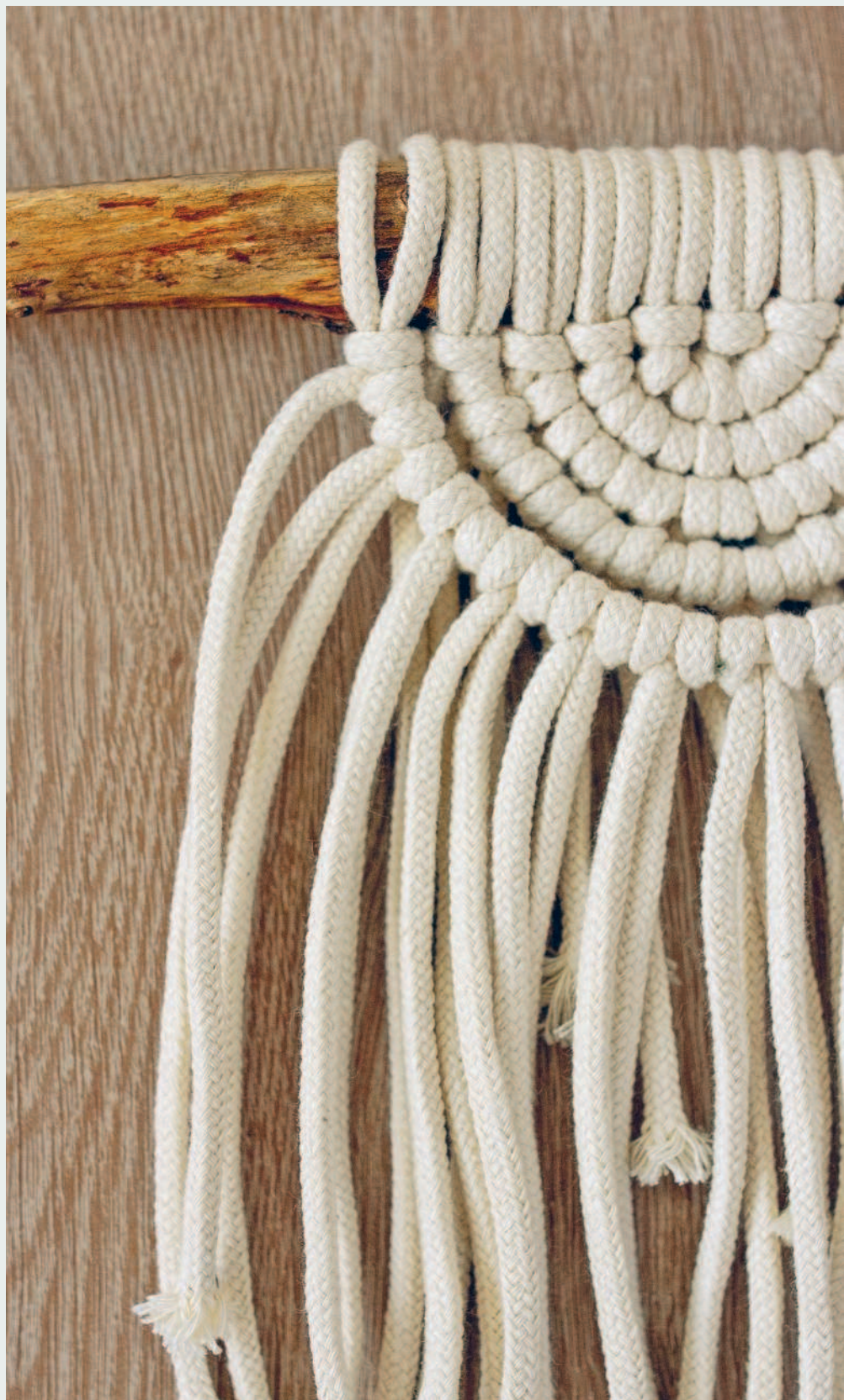
Пример плетения из хлопкового шнура ▶