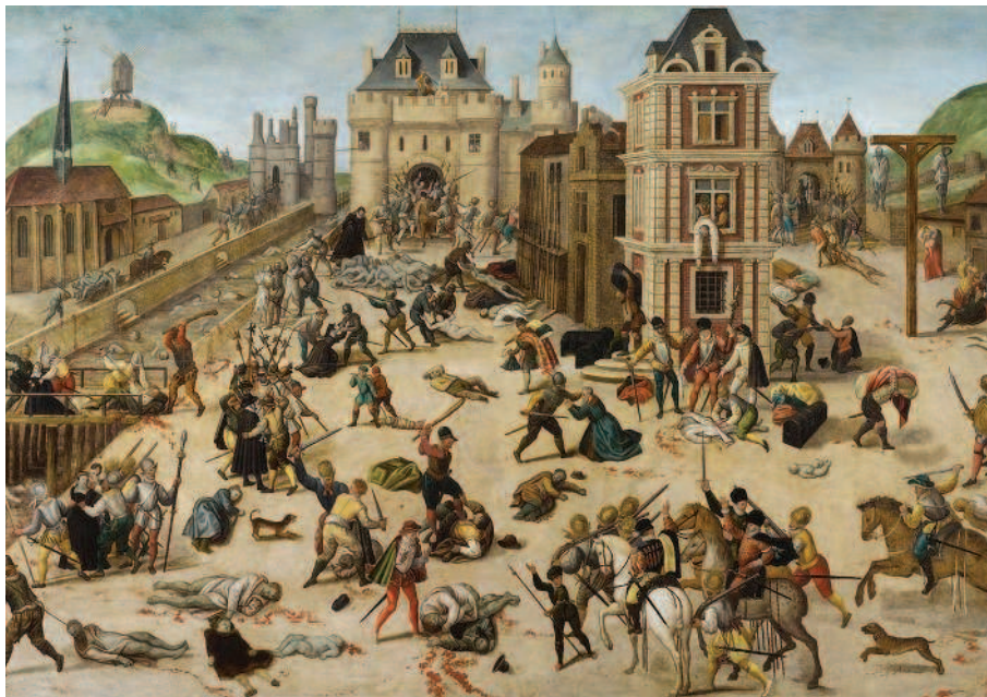
РИС. 1.2. ФРАНСУА ДЮБУА.

Возможно, вам известно понятие тотемизма. Само слово «тотем» появилось в научном обиходе относительно недавно, в конце XVIII столетия, благодаря английскому купцу и путешественнику Джону Лонгу. Он много времени провел среди представителей коренного населения Америки и услышал это слово именно от них. Но тотем и тотемизм как явления возникли в человеческом обиходе значительно раньше — и на разных землях для их обозначения использовались различные слова.