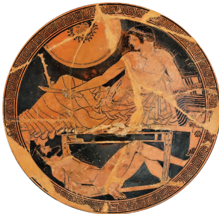
РИС. 1.5. АХИЛЛ С ТЕЛОМ ГЕКТОРА. РИСУНОК НА ГРЕЧЕСКОЙ ВАЗЕ. V ВЕК ДО Н. Э. ЛУВР. НА ЩИТЕ АХИЛЛА МОЖНО РАССМОТРЕТЬ УСТРАШАЮЩЕЕ ИЗОБРАЖЕНИЕ ГОРГОНЫ МЕДУЗЫ

Судя по всему, в Древнем Китае, античной Греции и Риме уже активно применяются личные, индивидуальные символы, которые воины и полководцы размещали на своих щитах и шлемах: так, изображая на щите волка или скорпиона, солдат рассчитывал таким образом