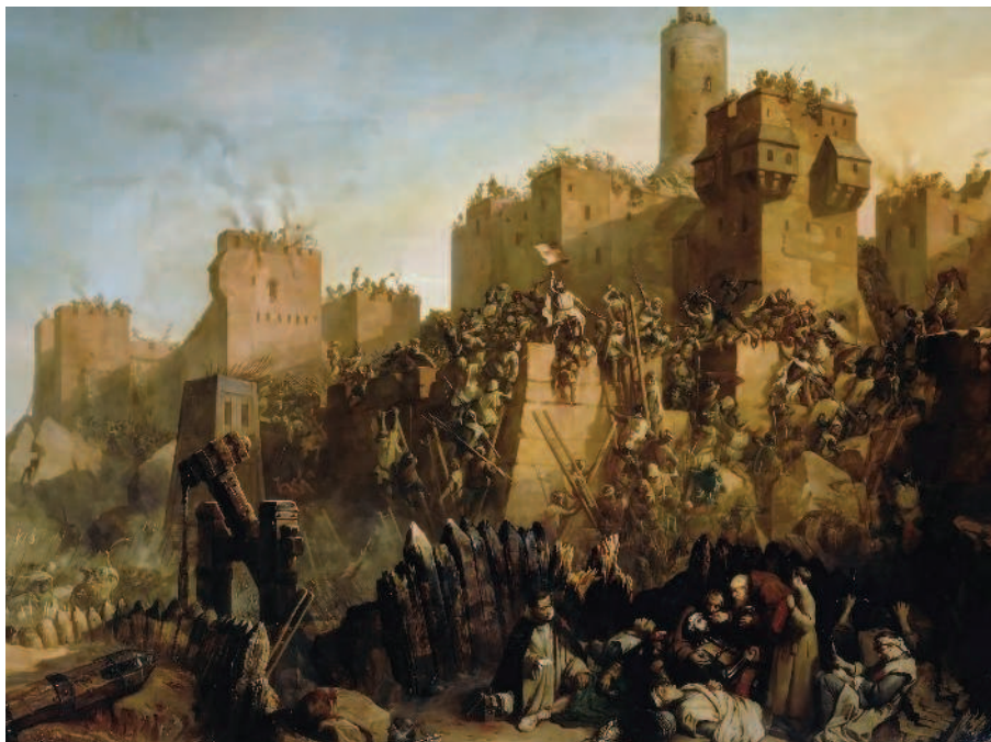
РИС. 1.1. КЛОД ЖАКАН.

Большинство исследователей утверждают: гербы рождаются в эпоху Средневековья, а появление их связано в большей степени с окончательным формированием феодальной схемы общества и с Крестовыми походами (рис. 1.1). В общих чертах это действительно так. И все же нужно учитывать, что прообразы личных и государственных гербов (а также флагов — две эти области очень тесно связаны друг с другом) появлялись еще в глубокой древности, задолго до наступления Средневековья.