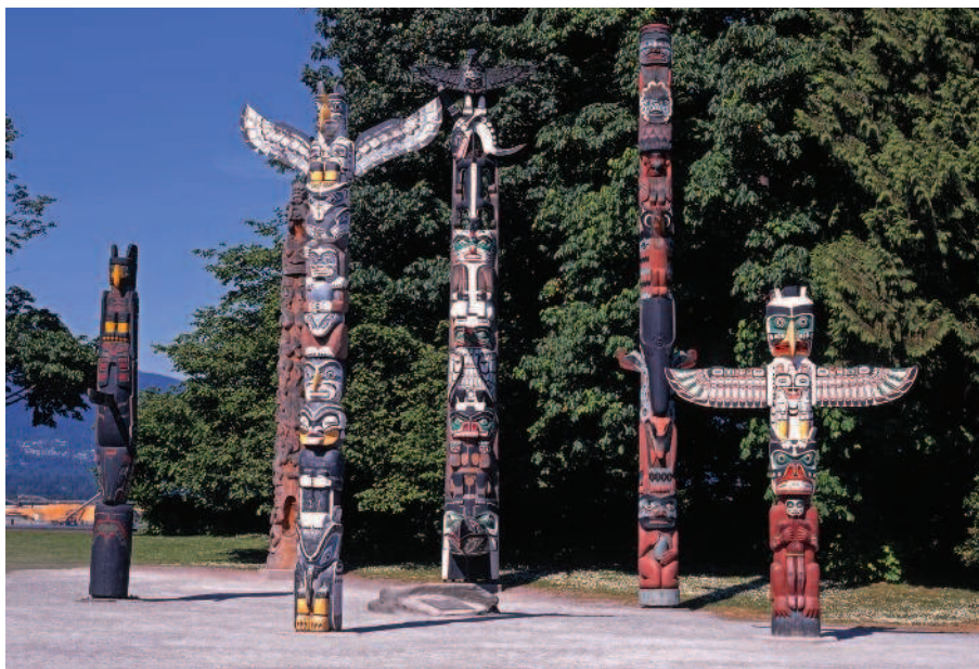
РИС. 1.3. СОВРЕМЕННЫЕ ИНДЕЙСКИЕ ТОТЕМНЫЕ СТОЛБЫ В ВАНКУВЕРЕ, КАНАДА

Разные народы использовали свои системы знаков для передачи той или иной информации. Это могли быть разноцветные ракушки, в определенной последовательности нанизанные на прут или лозу; зарубки на дереве; рисунки, оставленные на стенах пещер или примитивных построек. Видно, что уже в те далекие времена формировались вполне конкретные системы знаков и символов, которые в иносказательном виде — задолго до рождения письменности — могли донести до людей нужные сведения.