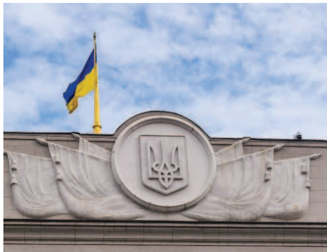
РИС. 1.7. ГЕРБ (И ФЛАГ) УКРАИНЫ НА ЗДАНИИ ВЕРХОВНОЙ РАДЫ В КИЕВЕ