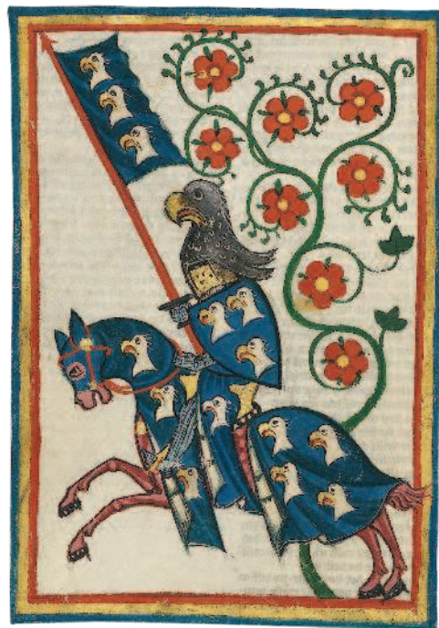
РИС. 1.8. ИЗОБРАЖЕНИЕ РЫЦАРЯ ИЗ «МАНЕССКОГО КОДЕКСА».

Конечно же, такое положение — когда требовалось очень четко понимать, где чья земля, — способствовало очередному этапу развития знаковых систем. Символ, который рыцарь-феодал наносил на свои доспехи и который первоначально связывался с личными качествами