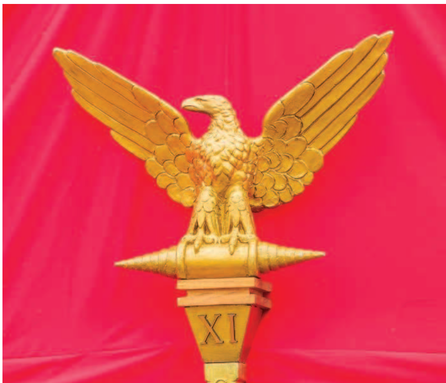
РИС. 1.6. ЛЕГИОННЫЙ ОРЕЛ. СОВРЕМЕННАЯ ИСТОРИЧЕСКАЯ РЕКОНСТРУКЦИЯ

Также в римской армии были распространены матерчатые штандарты с номерами подразделений — прообразы современных войсковых знамен.