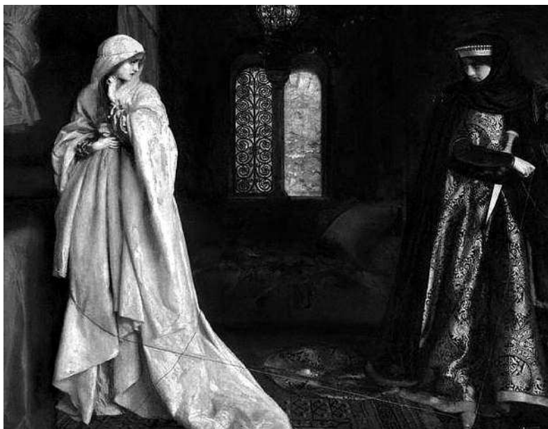
Ф.К. Купер. Королева Алиенора и Розамунда

Тут Генрих ошибался. Как только Фома Бекет сделался архиепископом Кентерберийским, он словно переродился: все дни он проводил в молитвах, благотворительности и посвящал Богу каждую секунду своей жизни.