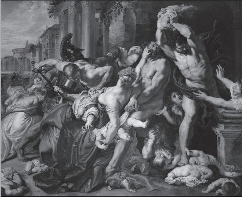
Избиение младенцев. Питер Пауль Рубенс. 1609–1610 гг.

хорошо это или дурно. Не спрашивают себя, хватит ли им духу вырвать плачущего ребенка из рук матери и совершить над ним казнь. Когда придет время, они выполнят приказ и сделают то, что должны сделать, — иначе сами будут казнены на месте за неповиновение.