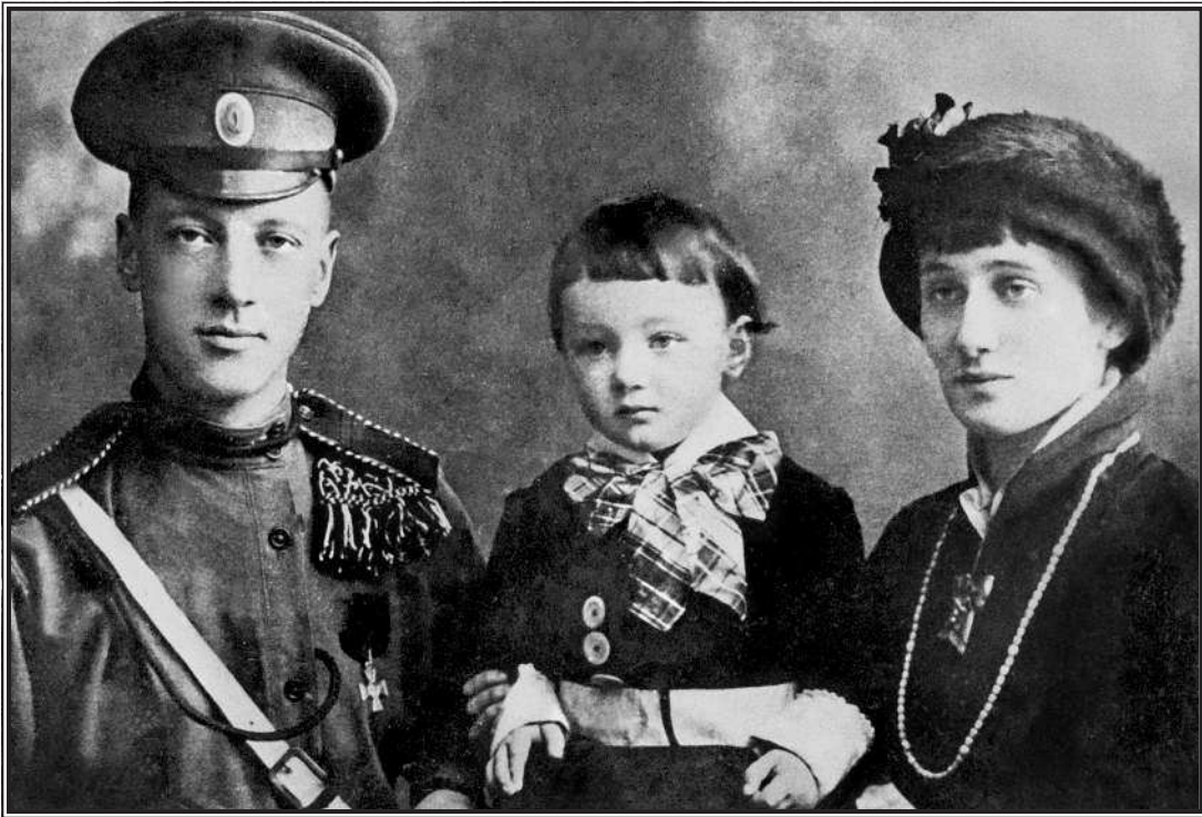
Николай Гумилев и Анна Ахматова с сыном Львом.