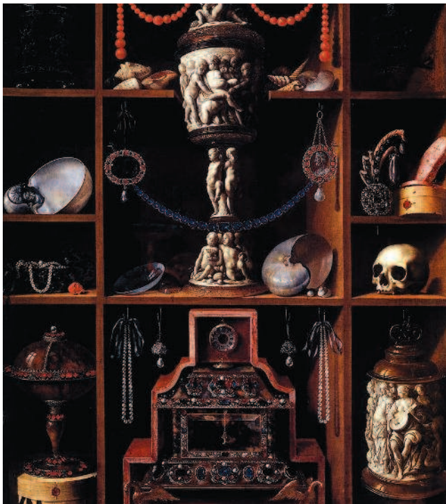
Рис. 1.14. Георг Хайнц. Коллекция редкостей, 1666 год. Кунстхалле, Гамбург

Скупка и коллекционирование старых монет были так же популярны, как создание художественных галерей и придворных театров. Но коллекционеров еще не называли нумизматами. Собиратели старины