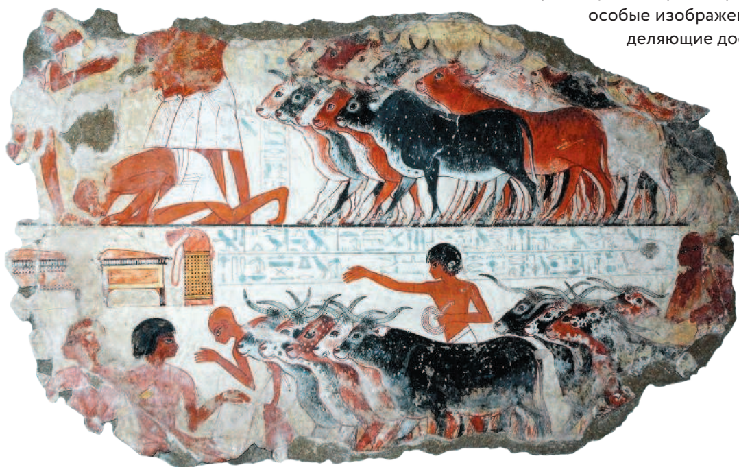
Рис. 1.5. Даже с появлением первых прототипов платежных средств торговля долгое время оставалась меновой (фреска «Подсчет коров» из «Гробницы Небамона», ок. 1350 г. до н. э. Британский музей)

Затем чеканку денег освоили на греческом острове Эгина, и вскоре монеты стали изготавливать по всему Средиземноморью. Куски металла, выступавшие в качестве платежного средства еще в древнейших государствах мира — Вавилонии и Египте, конечно, нельзя считать монетами в полном смысле этого слова (рис. 1.5). Это был так называемый металлический стандарт, когда покупательная способность определялась весом, количеством имеющегося у купца серебра или меди. Иногда роль денег играли металлическая посуда, браслеты и кольца. Термин «монета» относится прежде всего к узаконенному платежному средству стандартной формы и веса, имеющему особые изображения или надписи, определяющие достоинство.