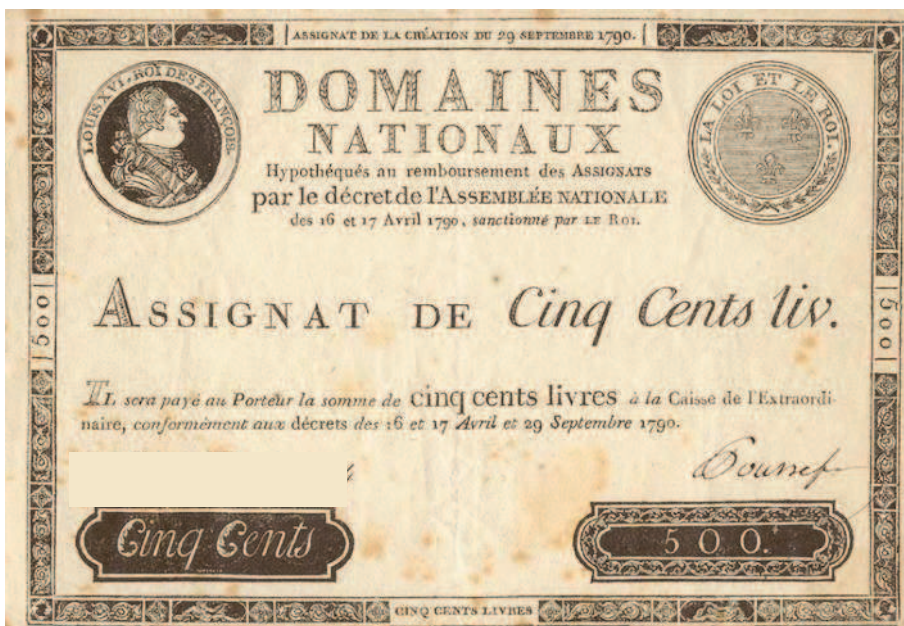
Рис. 1.10. Ассигнат времен Великой Французской революции, имевший силу законного платежного средства и официально обеспеченный государственным имуществом

По своей сути ассигнация — это аналог переводного векселя, которым вы можете заменять монеты, драгоценные камни, недвижимость или любое другое имущество, как бы «передавая» эквивалент стоимости этого имущества любым заинтересованным лицам. В Европе и Америке первые подобные платежные средства начали внедрять в XVII–XVIII столетиях (рис. 1.10). В России они впервые были изготовлены в годы правления Екатерины II.