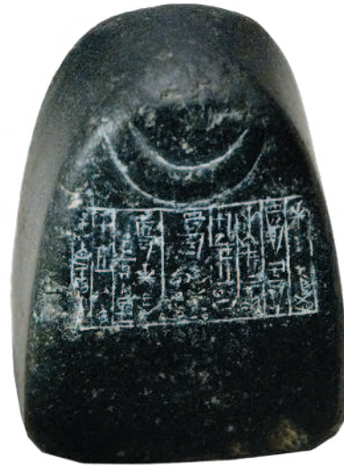
Рис. 1.2. Шумерский эталон веса — \frac{1}{2} мины (мина равнялась \frac{1}{60} таланта). Материал — диорит, магматическая горная порода. Ок. 2000 лет до н. э. Лувр

Таланты долгое время использовались как единицы массы и денежно-счетные единицы в Передней Азии, в северной Африке, в античной Греции и Риме — правда, вес и объем талантов везде были разными. Так, в Римской империи на протяжении многих лет талант соответствовал массе воды, налитой в стандартную амфору (около 26 литров) (рис. 1.3).