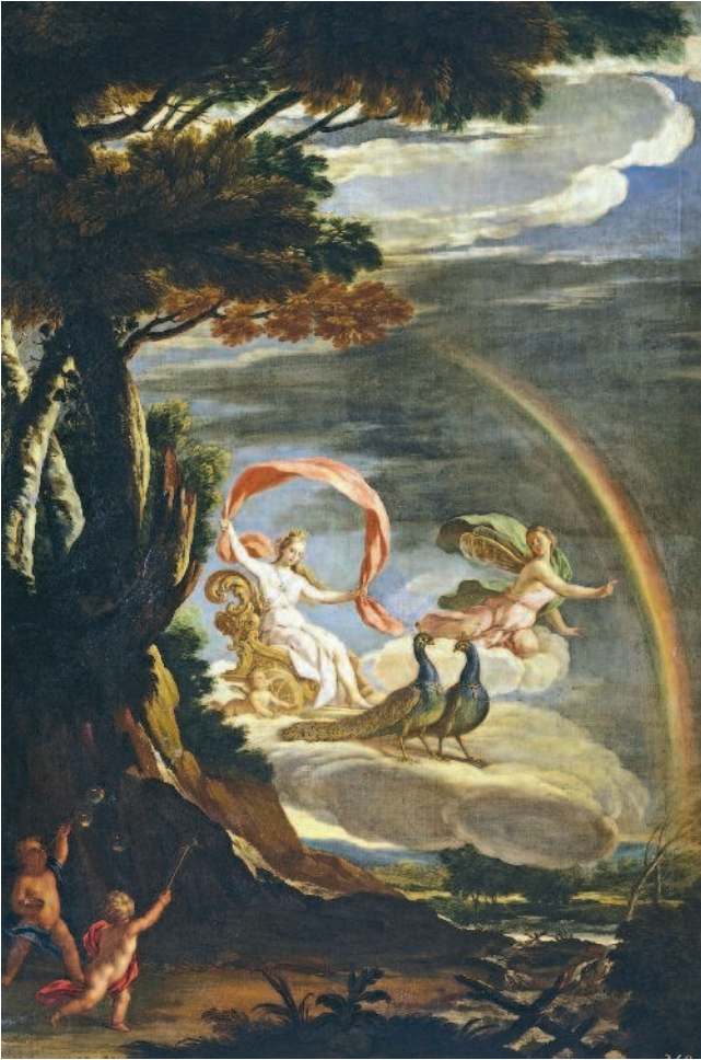
Рис. 1.6. Богиня Юнона у древних римлян — аналог греческой царицы богов Геры. Худ. А. Паломино. «Юнона на колеснице, запряженной павлинами» («Аллегория воздуха»), ок. 1700 года

В литературе встречаются также указания на то, что первые монеты были изготовлены в Китае еще в XI веке до нашей эры, но они не чеканились, а отливались в специальных, довольно примитивных, формах; так что, скорее, они были ближе к простым металлическим брускам и колечкам, наподобие вавилонских и египетских, нежели к монетам как таковым. Само же слово «монета» (moneta) родилось в Древнем Риме. Монетой, то есть советчицей, предостерегающей, называли богиню Юнону, изображение которой украшало древнеримские деньги (рис. 1.6, 1.7).