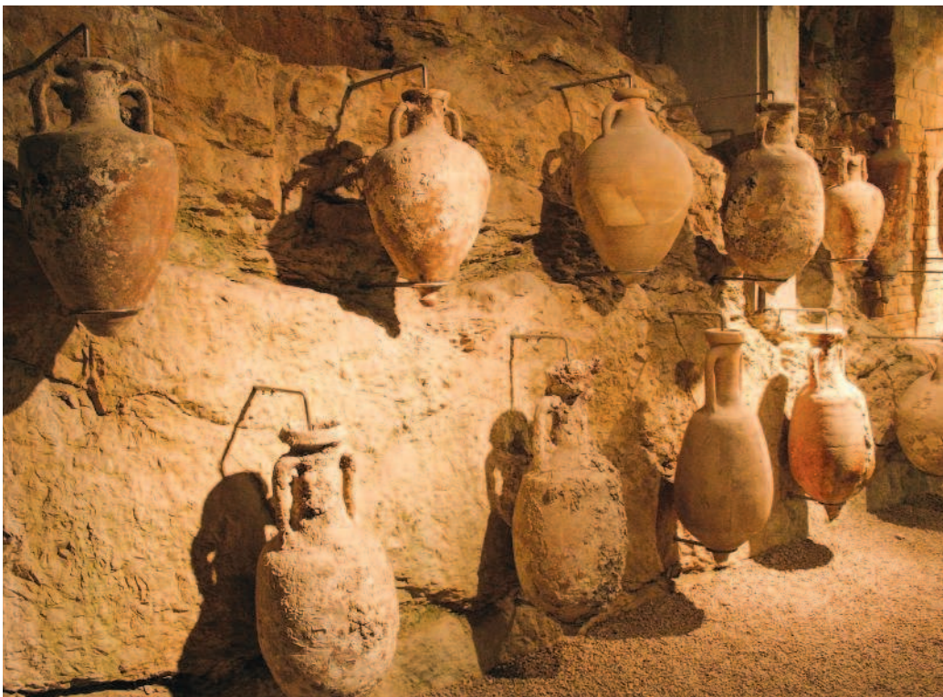
Рис. 1.3. Стандартные римские амфоры, вмещавшие около 26 литров воды (что соответствовало примерно 1 таланту)

Есть много любопытных историй о происхождении некоторых терминов, связанных с нумизматикой. Так, древние греки в качестве денег одно время использовали граненые металлические палочки, которые в количестве шести штук составляли одну драхму, в переводе — горсть (видимо, именно шесть палочек удобнее всего ложились в руку). Монета с названием «драхма» существовала в Греции вплоть до перехода на евро.