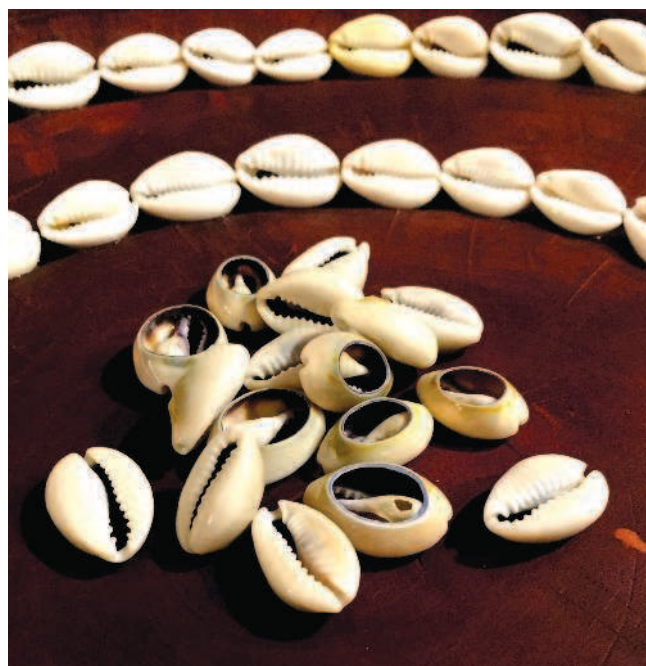
Рис. 1.1. Ракушины-каури играли роль денежных средств во многих регионах

С развитием городов значение скота как средства обмена понемногу снижалось, в первую очередь из-за неудобства расчетов. В то же время с расширением заморской торговли росла потребность в стандартных деньгах. Металл был избран как наиболее долговечный и дорогой материал. Интересно, что металлические предметы (например, ножи или наконечники стрел) изначально тоже служили средством платежа. До того как начали чеканить собственно монеты, то есть слитки определенной формы, веса, пробы и достоинства, взвешивали и отмеряли металл прямо на месте. С его куском (обычно это было серебро) покупатель приходил на рынок, взяв с собой гирьки и все необходимое для того, чтобы отрубить кусочек слитка. Достоинство платежного средства определялось его весом.