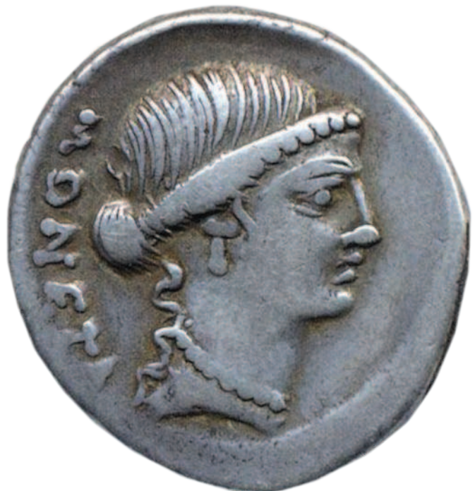
Рис. 1.7. Древнеримский денарий с изображением Юноны-Монеты

Петр I не просто, по выражению А. С. Пушкина, «Россию поднял на дыбы» — он изменил ход истории страны, выведя ее на европейскую арену. Seriously преобразилась тогда и монетная система Российского государства.