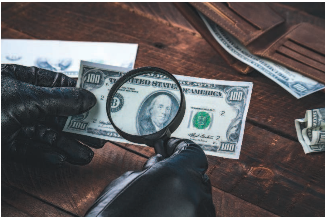
Рис. 1.8. Коллекции фальшивых платежных средств — от древности до наших дней, которые собирают отдельные музеи и частные собиратели, могут быть очень интересны

Появились новые виды монет, окончательно утвердился десятичный принцип при расчете номиналов, упорядочилась система денежного обращения, которая стала более удобной для нужд абсолютной монархии. Первые памятные российские монеты также были выпущены именно благодаря реформам Петра I.