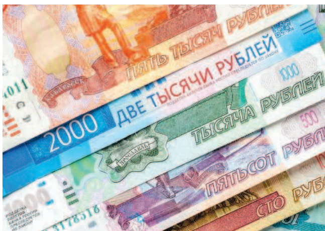
Рис. 1.11. Современные фиатные деньги

Кредитные деньги — это оформленное (обычно в виде ценной бумаги) право распоряжаться некоторой суммой средств с обязательством в дальнейшем возместить ее. Самый распространенный вид таких денег — векселя и чеки. Вексель — это ценная бумага, оформленная по определенным правилам и дающая возможность лицу, в руках которого находится вексель, получить от должника оговоренную в векселе сумму. Векселя и их разновидности часто упоминаются в мировой литературе, становясь в буквальном смысле основой сюжета: достаточно напомнить шекспировского «Венецианского купца» (рис. 1.12).