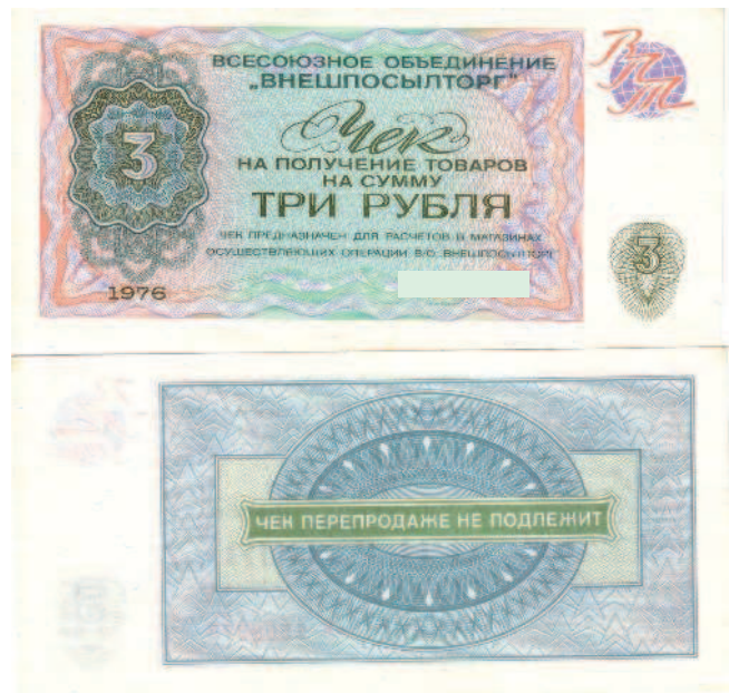
Рис. 1.9. Чеки «Внешпосылторга» для использования в магазинах «Березка» (в данном случае чеки 1976 года) часто относят к денежным суррогатам

Например, «ассигнация». Иногда ставят знак равенства между понятиями «бона» («бон»), «купюра», «ассигнация», «кредитный билет» и «бумажные деньги» в целом. С точки зрения экономики, это не совсем верно. В последующих главах мы вернемся к этим понятиям применительно к истории денежного обращения в России (так это будет более наглядно), а пока остановимся вот на чем. Первые бумажные деньги-ассигнации (правда, были они не совсем бумажными — использовались, судя по всему, волокна тутового дерева и хлопка) появились в Китае в VII — VIII веках нашей эры. Правда, самые ранние дошедшие до нас китайские бумажные деньги относятся лишь к XIII столетию.