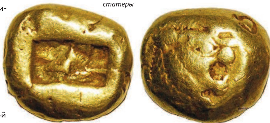
Рис. 1.4. Древние лидийские монеты — статеры

Первые монеты с примитивным обозначением номинала и государственной символикой появились, видимо, в Лидии (территория современной Турции) в VI веке до нашей эры. Лидийцы изготавливали свои монеты из электра — природного сплава золота и серебра — и называли их статерами. Сначала металл размягчали, нагревая, потом его укладывали на твердую основу и обрабатывали специальным молотом с рельефным рисунком для получения изображения. Обычно с одной