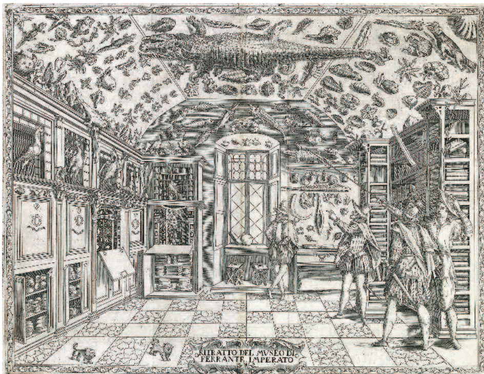
Рис. 1.15. «Кабинет редкостей» Ферранте Императо. Гравюра XVI в. Неаполь

Уже к середине XVI века во владениях европейских королей и аристократов насчитывалось более 900 мюнцкабинетов – собраний разнообразных монет, правда, нередко сформированных довольно хаотично. Для работы над коллекциями нанимали специальных сотрудников, в меру сил и возможностей занимавшихся систематизацией и описанием (рис. 1.15). Но научная ценность таких нумизматических трудов зачастую была сомнительной, так как нехватку достоверных сведений, незнание древних языков или античной истории исследователи могли возмещать домыслами, не имеющими никакого отношения к научному подходу. Основы научной нумизматики заложил профессор археологии Венского университета, священник Иоганн Иосиф Иларий Эккель (1737–1798). С 1774 года он был директором Собрания антиков Венского мюнцкабинета. Именно Эккель предложил систематизировать античные монеты по историко-географическому принципу, ставшему общепризнанным. Итогом его многолетней кропотливой работы на ниве