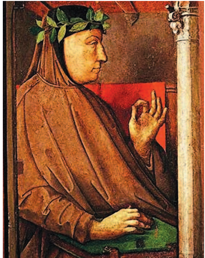
Рис. 1.13. Йос ван Гент. Портрет Франческо Петрарки, XV в. Национальная галерея Марке

Начало частного коллекционирования многие исследователи связывают с Древней Грецией и затем с впитавшими греческую культуру эллинистическими государствами и Римской империей. Последовательно поглощая территории Средиземноморья, Рим присваивал не только земли и имущество побежденных народов: трофеями становились также произведения