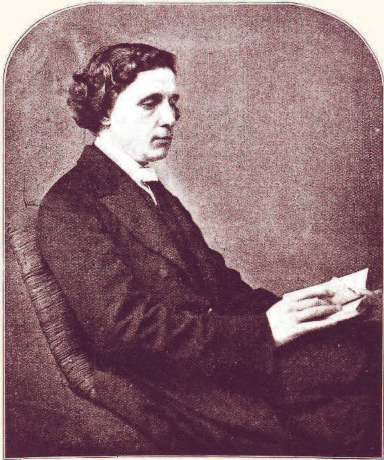
Льюис Кэрролл (1832–1898)