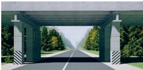
Пересечение дорог на разных уровнях перекрестком не является

диняющими соответственно противоположные, наиболее удаленные от центра перекрестка начала закруглений проезжих частей. Не считаются перекрестками выезды с прилегающих территорий.