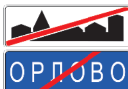
5.24.2, 5.26 Конец населенного пункта