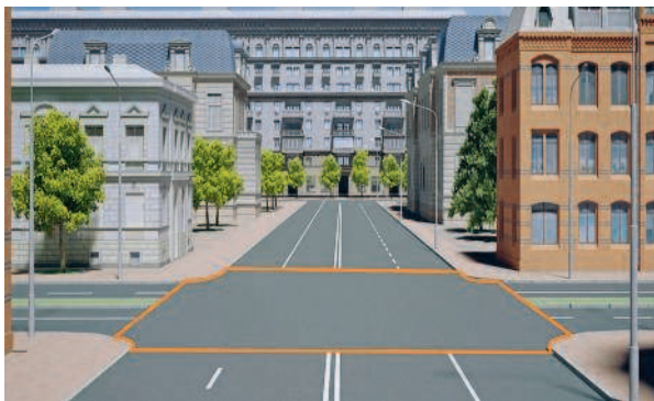
Границы перекрестка обозначены оранжевой линией и включают пересечение проезжих частей от начала их закруглений

«Перекресток» – место пересечения, примыкания или разветвления дорог на одном уровне, ограниченное воображаемыми линиями, сое-