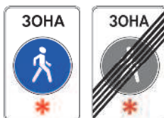
5.33 Пешеходная зона

«Пешеходная зона» – территория, предназначенная для движения пешеходов, начало и конец которой обозначены соответственно знаками 5.33 и 5.34.