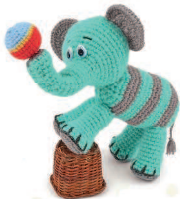
Слоненок Уилли 37