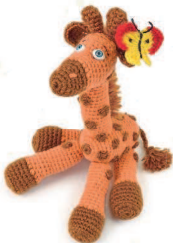
Жираф Отто 47