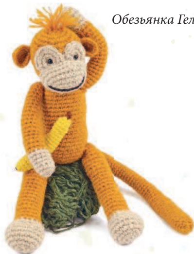
Обезьянка Геля 42