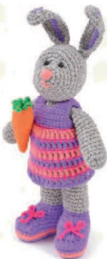
Зайка Дарси 54