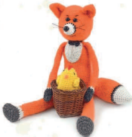
Лисенок Арчи 61