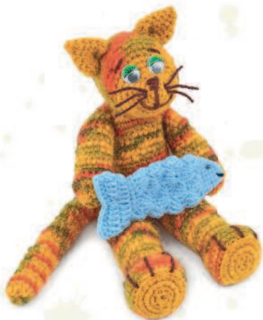
Котик Луис 68