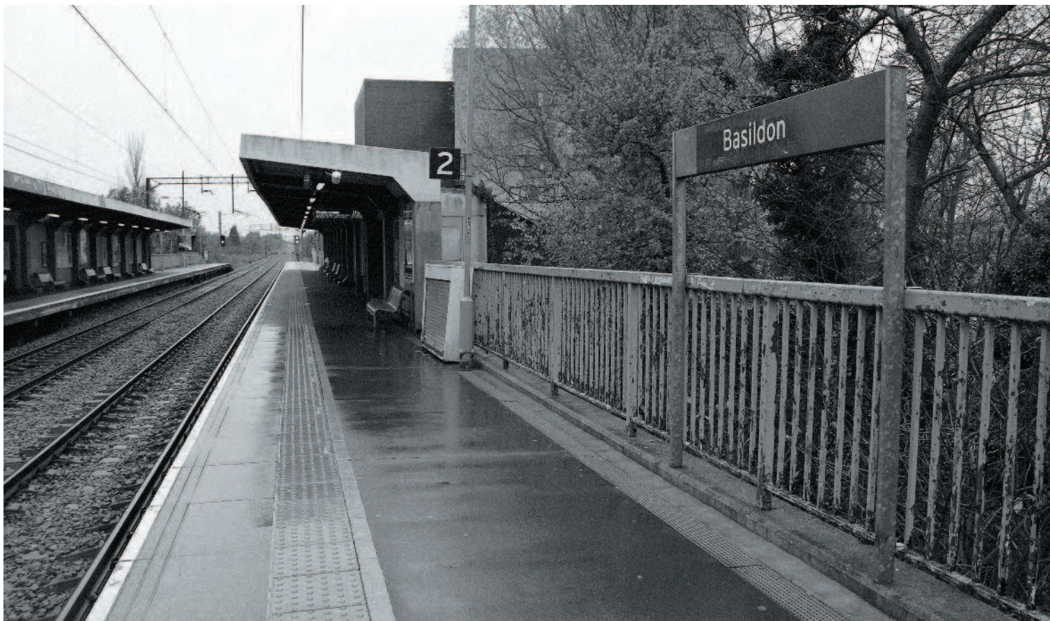
БАЗИЛДОН, ЖЕЛЕЗНОДОРОЖНАЯ СТАНЦИЯ. Доброе утро, Печаль...

Традиционные для любой рок-группы гитара, бас и ударные уступили место новым инструментам — удивительным творениям электронной музыки: всего несколько лет назад драм-машины и синтезаторы были непозволительной роскошью для подростков из рабочих предместий, а теперь все больше ребят могли воспроизводить себе купить эти футуристичные штуковины, которые вполне способны были оказаться в кабине «Тысячелетнего сокола» Хана Соло. Началась новая эра: в 1982 году в заметке в немецком журнале Der Spiegel речь шла о «поп-музыке для поколения "Звездных войн"», и имелось в виду бесчисленное множество новых британских электронных групп. Раньше монофонические синтезаторы могли производить за раз всего один звук и играть на них можно было одним пальцем. Не требовалось знать аккорды, чтобы создавать мелодии. Одним из самых радикальных примеров этой новой футуристичной электронной музыки стала немецкая электро-панк-группа Deutsch Amerikanische Freundschaft («Германо-американская дружба»), сокращенно DAF, в особенности их LP-альбом (долгоиграющий) Die Kleinen und Die Bösen .