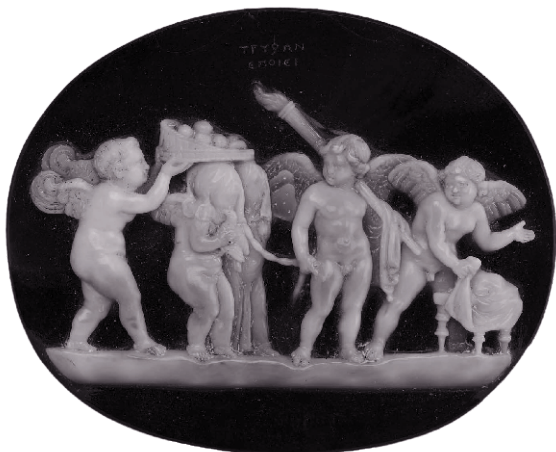
Купидоны на свадьбе. Обратите внимание на фрукты (яблоки или гранаты), на поводок и на то, что один из купидонов держит факел вместо лука

неделя изжоги. Автор снимает с себя ответственность за любые последствия — физические, психологические и моральные.