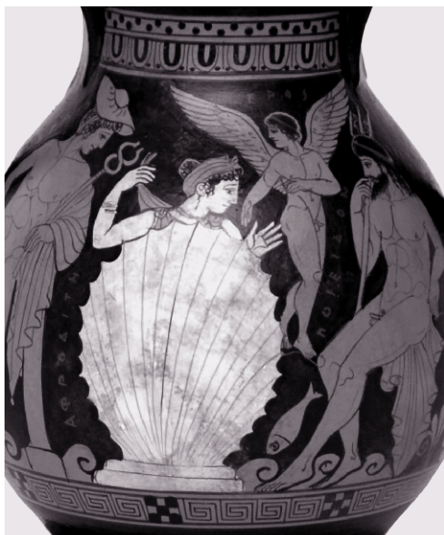
На этой краснофигурной афинской вазе Афродита рождается из морской раковины, символизирующей гениталии (в данном случае Урана)

любовные заклятия агонистическими и противопоставляют их более мирным чарам-филиям — тем, что усиливают привязанность и укрепляют союз двух душ.