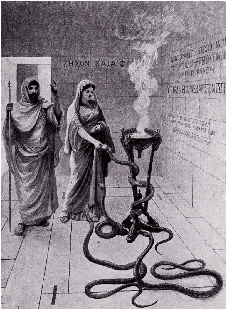
Кормление священных змей в храме Асклепия на острове Кос