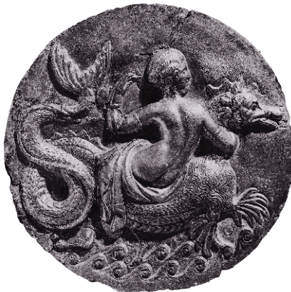
Нереида верхом на ketos (морском чудище)

Итак, прежде всего необходимо забыть о «сверхъестественном». Однако, чтобы понять, что такое магия древности, нам придется еще много чего выбросить из головы. В нашем мире — особенно на Западе — религия уже давно присвоила исключительное право на взаимодействие с невидимыми силами и субстанциями. В древности такой монополии не существовало. Религиозный институт спонсировался государством, а вера воспринималась как гражданский долг каждого человека; задача религии состояла в том, чтобы поддерживать мир