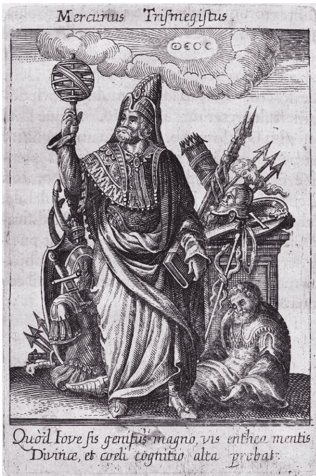
Меркурий (Гермес) Трисмегист, «рожденный великим Юпитером, одаренный силой божественного разума, ведающий тайны небес»