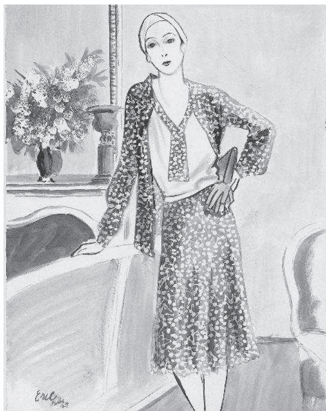
Стильный портрет работы Эрика.

Главная цель этой книги — помочь вам обрести свой собственный стиль, такой же уникальный и неповторимый, как и руки, которыми вы будете создавать свои рисунки. Хотя все упомянутые мной художники творили в единой эстетике, каждый из них шел своим собственным путем, поэтому возьмите понемногу от каждого — это поможет вам найти свое место в мире искусства изображения моды.