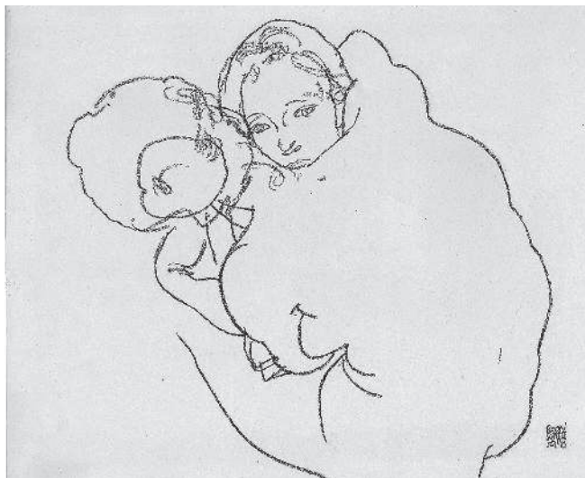
Мать и дитя. Рисунок карандашом Эгона Шиле, 1918.