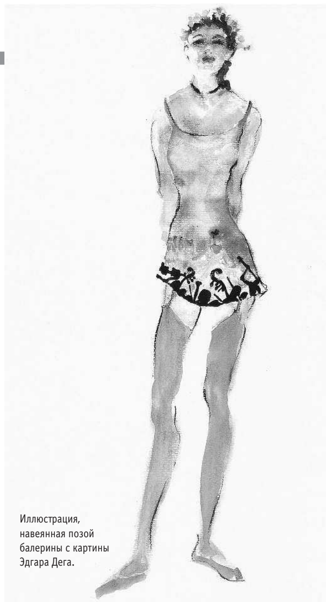
Иллюстрация, навеянная позой балерины с картины Эдгара Дега.

Рисунки Вивьен Вествуд, с ее великолепными силуэтами, историческими пометками и образцами тканей, отлично передают движение и страстность, которыми пронизан ее показ. Довольно трудно изобразить свободное движение в одежде в крупную клетку, но умение показать это так, чтобы рисунок передавал безумный шум и суету показа, присутствие множества известных персон и неповторимую индивидуальность моделей, дорогого стоит.