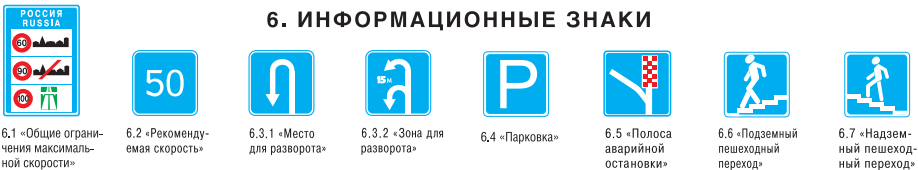
6.1 «Общие ограничения максимальной скорости»