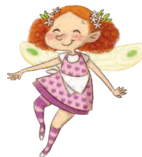
Пшеничка и Корица