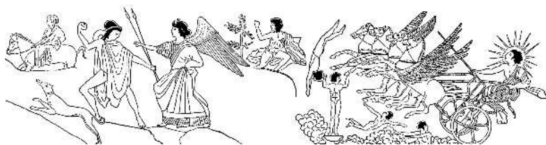
Эос и (или) Гелиос

землю, заливая все серебристым сиянием. Объехав небесный свод, богиня Луна спустится в глубокий грот горы Латма в Карию. Там лежит погруженный в вечную дремоту прекрасный Эндимион 1 . Любит его Селена. Она склоняется над ним, ласкает его и шепчет ему слова любви. Но не слышит ее погруженный в дремоту Эндимион, потому так печальна Селена и печален свет, который льет она на землю.