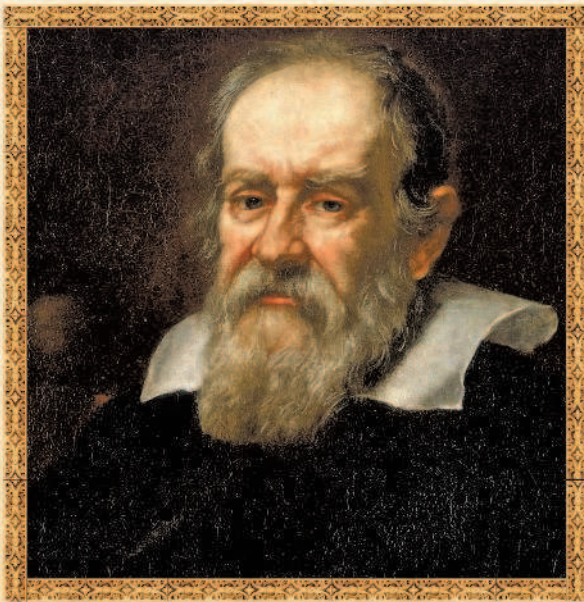
Галилео Галилей (1564–1642) — итальянский физик, механик, астроном, философ и математик

В современной нумерологии числа отражают основные значения из далекого прошлого, соединенные со многими дополнительными духовными толкованиями. Значение имен имеет глубокий смысл и может быть описано буква за буквой и число за числом по мере того, как мы в своей жизни достигаем определенных циклов выражения год за годом.