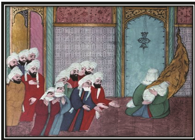
Амина, мать Мухаммада, показывает новорожденного мекканцам

По мнению ал-Хорезми, высказанному в «Книге истории», на которое ссылается и с которым солидарен ал-Бируни, Мухаммад родился «в ночь на понедельник 17 Дей-Маха в сорок втором году царствования Ануширвана или 20 Нисана 882 года эры Александра...» 2 . Знаменитый средневековый историк Исма‘ил ибн ‘Умар ал-Бусри, наиболее известный как Ибн Касир (1301–1373), считал, что Мухаммад, «вероятнее всего», родился в понедельник девятого числа месяца раби I (апрель 571 г.) 3 .