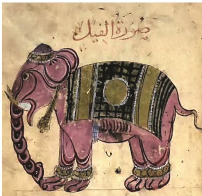
Иллюстрация к суре Ал-Фил («Слон»)

с 570 г. по григорианскому календарю. В-третьих, сюжет о попавшем впро- сак химйарском правителе и его войске впоследствии нашел свое отражение в Коране, в главе, которая так и называется – «Слон» (105:1–4).