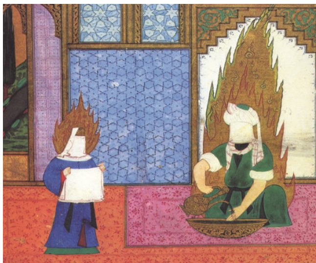
Первое омовение Хадиджи и Мухаммада

При упоминании имени Хадиджи неизменно возникает слово «первая». Она была первой женой Мухаммада, с которой он прожил без малого четверть века (595–619). Она первой уверовала в пророческую миссию Мухаммада и стала первой принявшей ислам среди всех мусульман.