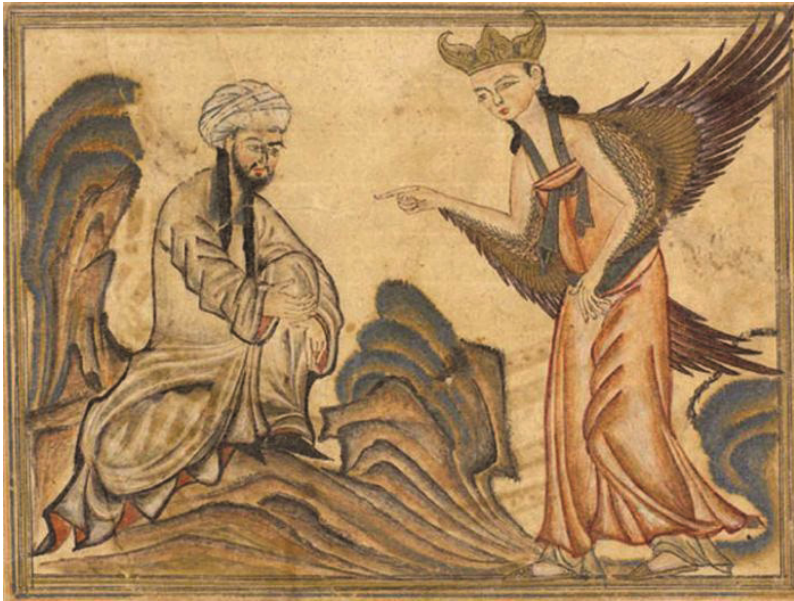
Мухаммад получает первое откровение*

Беда была в том, что точная дата этого события осталась неизвестной. Позже, при составлении первых жизнеописаний пророка Мухаммада, большинство мусульманских историографов сошлись во мнении, что его первая встреча с Джабраилом состоялась 17 числа месяца рамадана 920 г. эры Селевкидов, т.е. в 610 г. от Рождества Христова, на сороковом году жизни Пророка. Но халиф ‘Умар не мог этого знать, так как его уже не было в живых.