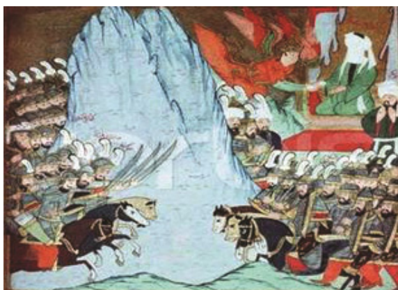
Битва мусульман с мекканцами при Бадре

С чем может быть связано отсутствие реальной информации о первых мужьях Хадиджи? Во-первых, Мухаммад никогда не касался тем, связанных с «прошлой жизнью» Хадиджи, а почитавшие ее биографы старались реже вспоминать о предыдущих браках первой мусульманки. Во-вторых, персоны 'Утаййика и Абу Халы не были в чести у мусульманских авторов. Первый из них принадлежал к враждебно настроенному против Мухаммада курайшитскому роду Махзум, и многие его ближайшие родственники воевали против мусульман в битвах при Бадре (624) и Ухуде (625) на стороне язычников.