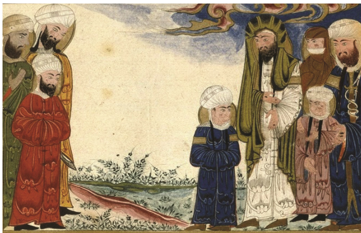
Мухаммад, Фатима, ‘Али, ал-Хасан и ал-Хусайн

между шиитами и суннитами касались прежде всего «широкого круга», из которого шииты исключали потомков дяди Пророка ал-Аббаса – Аббасидов, а сунниты, в свою очередь, не отдавали предпочтения потомкам ‘Али и Фатимы. Со временем эти разночтения переросли в непримиримые противоборства семейных кланов за приоритет в мусульманской общине. Особенно ярко это проявилось в борьбе за власть после низвержения правителей Омейядского и образования Багдадского (Аббасидского) халифата.