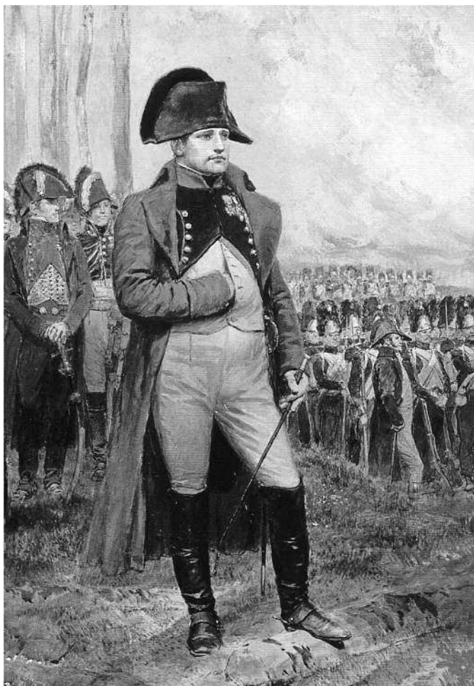
Жан Батист Эдуард Детайль. Наполеон в 1806 году

Таково начало, а вот конец: «Дело наполеоновской политики есть дело эгоизма, которому служит гений; в его общеевропейском здании, так же как во французском, надо всем господствовавший эгоизм испортил всю постройку». Наполеон среди людей — «великолепный хищный зверь, пущенный в мирно жующее стадо». «Он обнаруживает безмерность и свирепость своего самолюбия», когда в 1813 году, в Дрездене, говорит Меттерниху: «Такой человек, как я, плюет на жизнь миллиона людей!», «Положительно, с таким характером, как у него, нельзя жить; гений его слишком