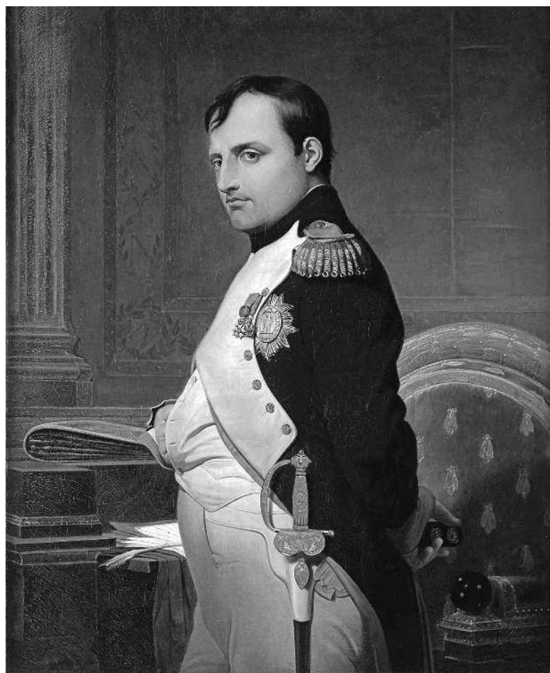
Поль Деларош. Наполеон I Бонапарт. 1807 г.

Маленькими глазками, увеличивающими, как микроскопы, лилипуты видят каждую клеточку Гулливеровой кожи, но лица его не видят; оно им кажется страшным и мутным пятном; маленькими аршинами могут они