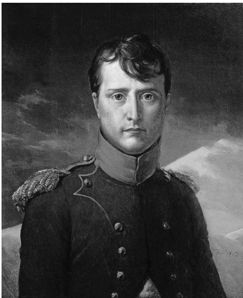
Франсуа Жерар. Наполеон Бонапарт — Первый консул. 1803 г.

«Если бы мне удалось сделать то, что я хотел, я умер бы со славой величайшего человека, какой когда-либо существовал. Но и теперь, при неудаче, меня будут считать человеком необыкновенным». Эго, пожалуй, слиш-