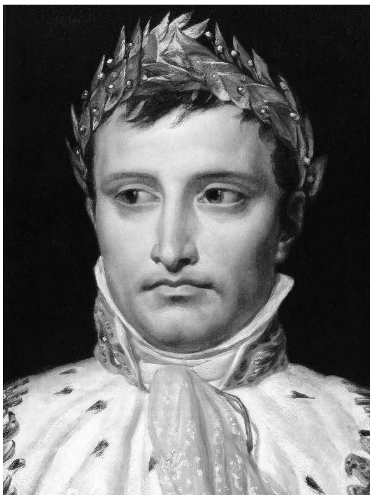
Жак-Луи Давид. Набросок для портрета Наполеона I в коронационном костюме

Блуа считает себя «добрым католиком», а добрые католики считают его злейшим еретиком. Но нет никакого сомнения, что он христианин, или, по крайней мере, хочет быть христианином. Но иногда и христианину трудно решить, молится ли Блуа или кощунствует. Во всяком случае, он слишком легко и смело решает, что Наполеон есть «предтеча Того, Кто должен прийти». — Кого именно, остается неясным, но, кажется, — Пара-