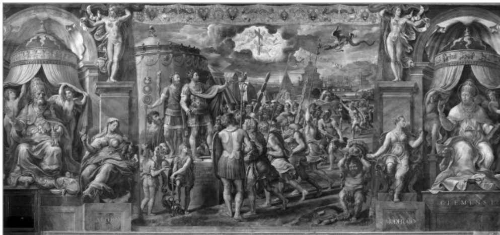
Рис. 1. «Видение креста»

Обратите внимание на полную версию этой фрески.