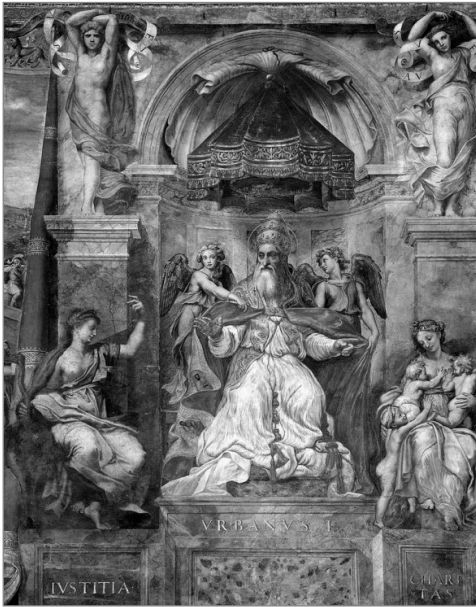
Рис. 2. Урбан I

Зрители среди этого немыслимого множества символов и аллегорий зашоренным вниманием протягивают свой взор туда, куда его ведут – в центральную часть картины. Именно здесь сконцентрирован смысловой апофеоз полотна. И именно эта часть фресок в абсолютном большинстве случаев репродуцируется в интернете. Восторг от созерцания этого шедевра отвлекает внимание от существенных фланговых фрагментов картины. А они не менее интригующие.