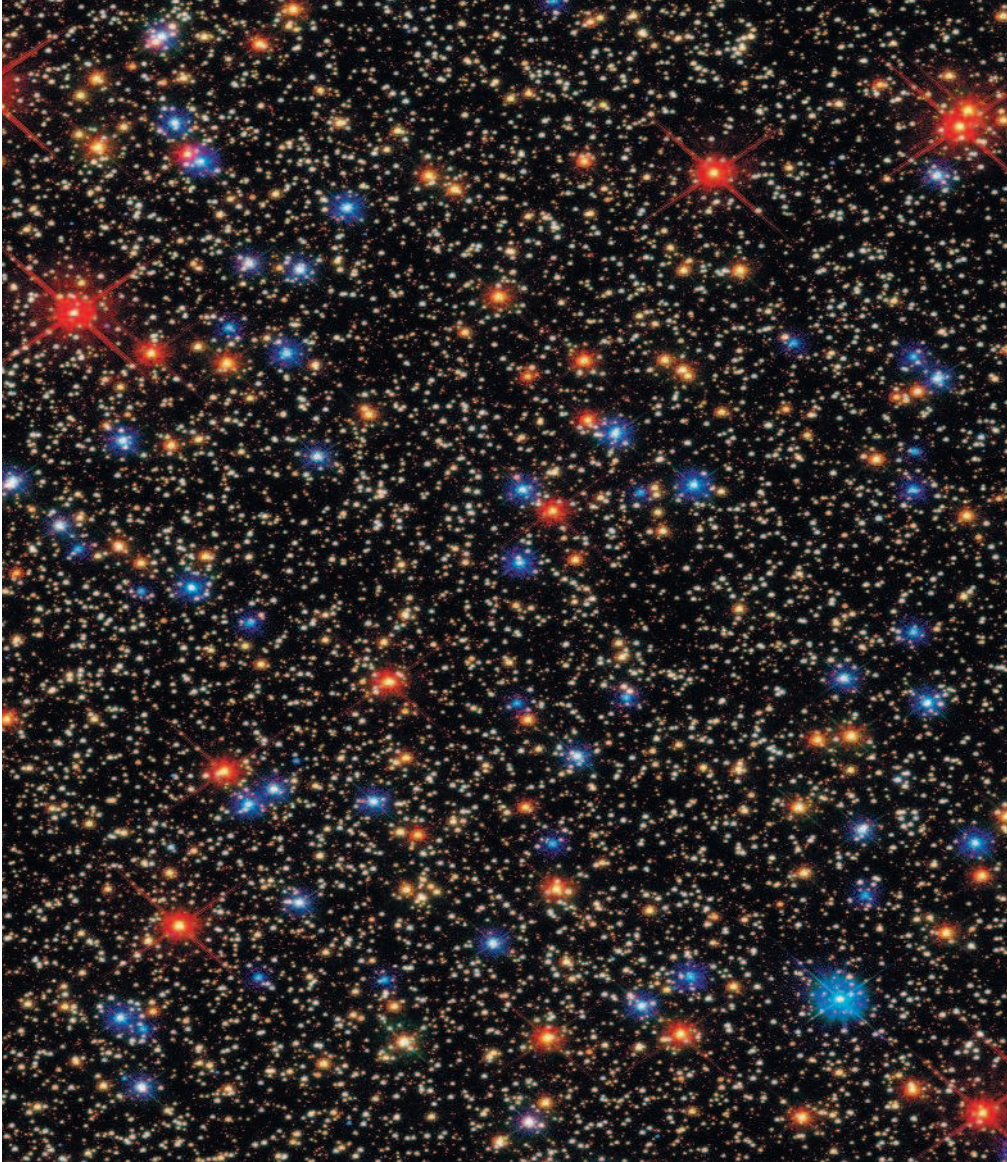
Ядро шарового скопления \omega Центавра содержит разнообразные звезды на разных стадиях эволюции: от очень старых (оранжевых и красных) до загадочных «голубых странников»: старых звезд, омолодившихся за счет столкновений.

публикациях сквозило восхищение. Как сказал один специалист по истории искусств, «"Столпы Творения" вызвали одновременный резонанс в религиозных кругах и среди популяризаторов науки». Со временем «Хаббл» предстояло стать знаменитостью и войти в поп-культуру, обзаведясь собственной армией поклонников.