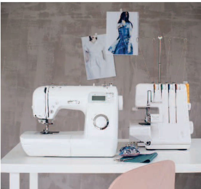
Качественная швейная машина (слева) — ваш главный помощник! Если вы планируете много шить, обязательно покупайте оверлок (справа).

Он не служит заменой стандартной швейной машины, а дополняет ее. С помощью оверлока можно обрабатывать срезы ткани строчкой или сшить вместе два отреза эластичной ткани, при этом их срезы будут одновременно обрезаться и обрабатываться швом. Кроме этого, на оверлоке можно обработать кромку плоским швом (► с. 160) или выполнить роликовый шов, который прекрасно смотрится на прозрачных тканях, шелке и шифоне. Многие начинающие швеи сомневаются в покупке оверлока. Мы советуем приобрести оверлок, если вы часто работаете