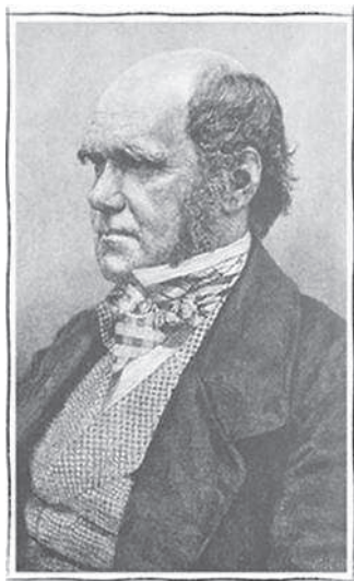
Чарльз Дарвин в 45 лет. 1854

26 лет, а вернулся он в 31 год*. Самая известная его книга — «Происхождение видов» — вышла, когда Чарльзу исполнилось уже 50. Как признался Дарвин в автобиографии, он не слишком жаловал возрастные изменения: «Как было бы здорово, если бы ученые умирали в 60 лет, так как, проходя этот рубеж, они всегда противятся любой новой теории!**».