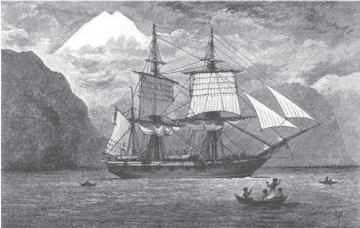
«Бигль» в Патагонии

разнообразный мир живой природы заставило его снова обратиться к тем постулатам, которые он усвоил за время учебы. Никогда всерьез не раздумывая над религией, он не ставил под сомнение взгляды креационистов, которых придерживалось большинство преподавателей в Англии той эпохи. Если буквально следовать тексту Библии, то все виды растений и животных, а также человек были созданы Богом в первые шесть дней Творения и не изменились с того момента.