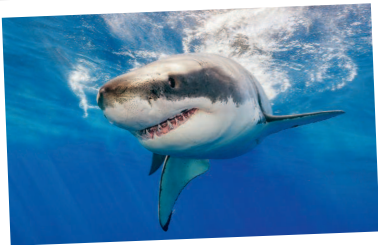
Большая белая акула

Больше шестидесяти тысяч котиков на маленьком пятачке! Но не все так безмятежно. С мая по сентябрь вокруг острова образуется «кольцо смерти». В залив приходят большие белые акулы , которые начинают здесь свою охоту.