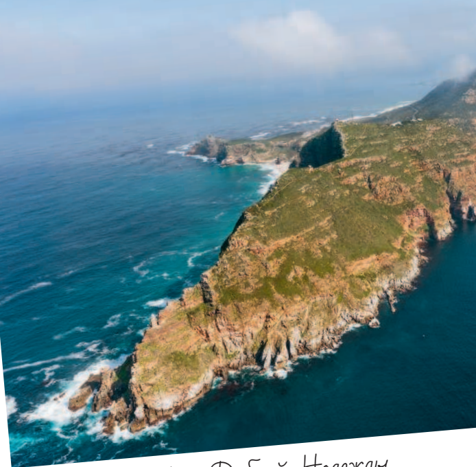
Мыс Доброй Надежды

Мы едем к мысу Доброй Надежды. Справа — всегда беспокойный Атлантический океан с обрывистым и каменистым берегом.