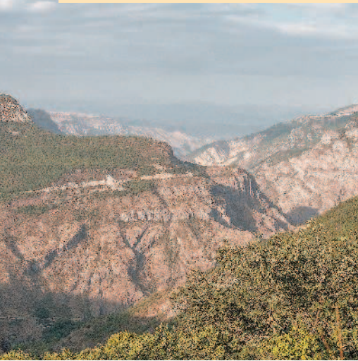
Панорама гор и Татевского монастыря.