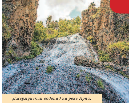
Джермукский водопад на реке Арпа.

часто идут ливни. Обычно тучи собираются к середине дня и начинается дождь, зачастую с грозой и градом. Самые сухие месяцы – август и сентябрь.