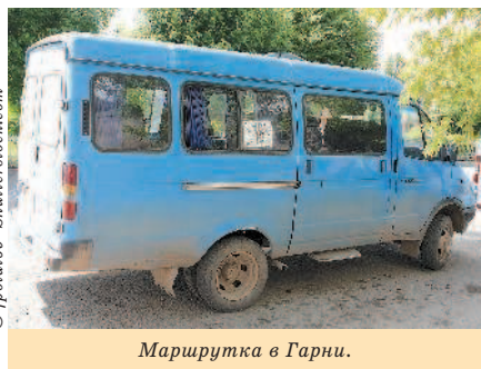
Маршрутка в Гарни.

Ну и несколько слов о международных маршрутках, которыми можно добраться до Еревана из некоторых российских городов. Людям со славянским менталитетом они вряд ли подойдут. Во-первых, расписания как такового не существует. Отправление могут задержать, прибытие тоже не обозначено. Водитель может останавливаться возле любого кафе на любое