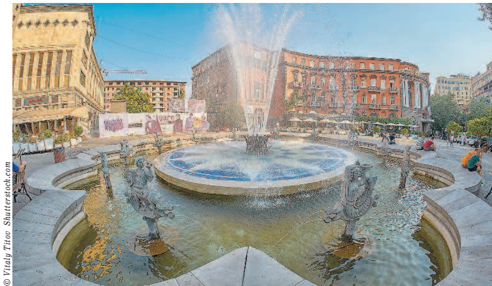
Площадь Шарля Азнавура на пересечении улиц Туманяна и Абовяна в Ереване.

Найти гостиницу в Ереване – не проблема. Проблема – найти недорогую гостиницу. Если вы привыкли путешествовать бюджетно, то жилье придется поискать, так как большинство отелей рассчитано на состоятельных туристов, а не на спартанцев, которым лишь бы где-то перекантоваться. Хостелов тоже почти нет.