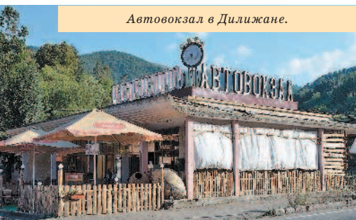
Автовокзал в Дилижане.