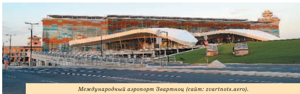
Международный аэропорт Звартноц (сайт: zvartnots.aero).