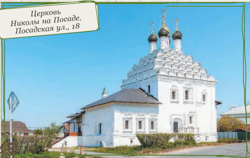
Церковь Николая на Посаде. Посадская ул., 18

Загадочное квадратное строение посередине церковного двора — остатки первого яруса отдельно стоящей колокольни. Шатровую колокольню 1716 года постройки уничтожили в советское время. Советский Союз во многом был противоречивым, несуразным и угловатым — с церковью боролись, а вот памятники церковной архитектуры восстанавливали. В 70-е годы XX века провели серь-