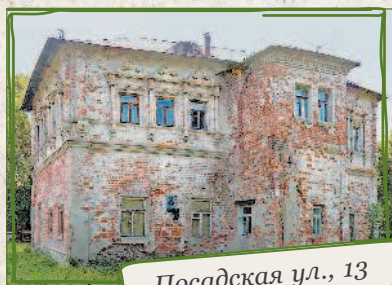
Посадская ул., 13

От Дома воеводы советую пройти на Москворецкую улицу, где подряд стоят три дома, богато украшенные резьбой (Москворецкая ул., 17–15–13). Дома начала XX века обшиты тесом поверх бревен. Дома с маленькими мезонинами. Мезонины с балкончиками, балясинами и фигурными подзорами. А широкие резные наличники, кажется, собрали все виды узоров! Напротив построен комплекс таунхаусов. Без резьбы,