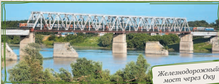
Железнодорожный мост через Оку