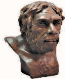
Реконструкция М. М. Герасимова. Неандерталец

Прямохождение, которое было свойственно представителям рода гоминид, высвобождало передние конечности для манипулирования предметами в качестве орудий труда, а увеличение мозга расширяло