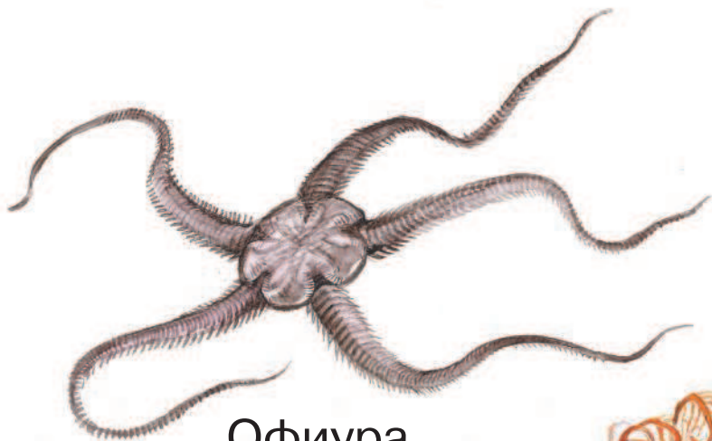
Офиура, или змеехвостка