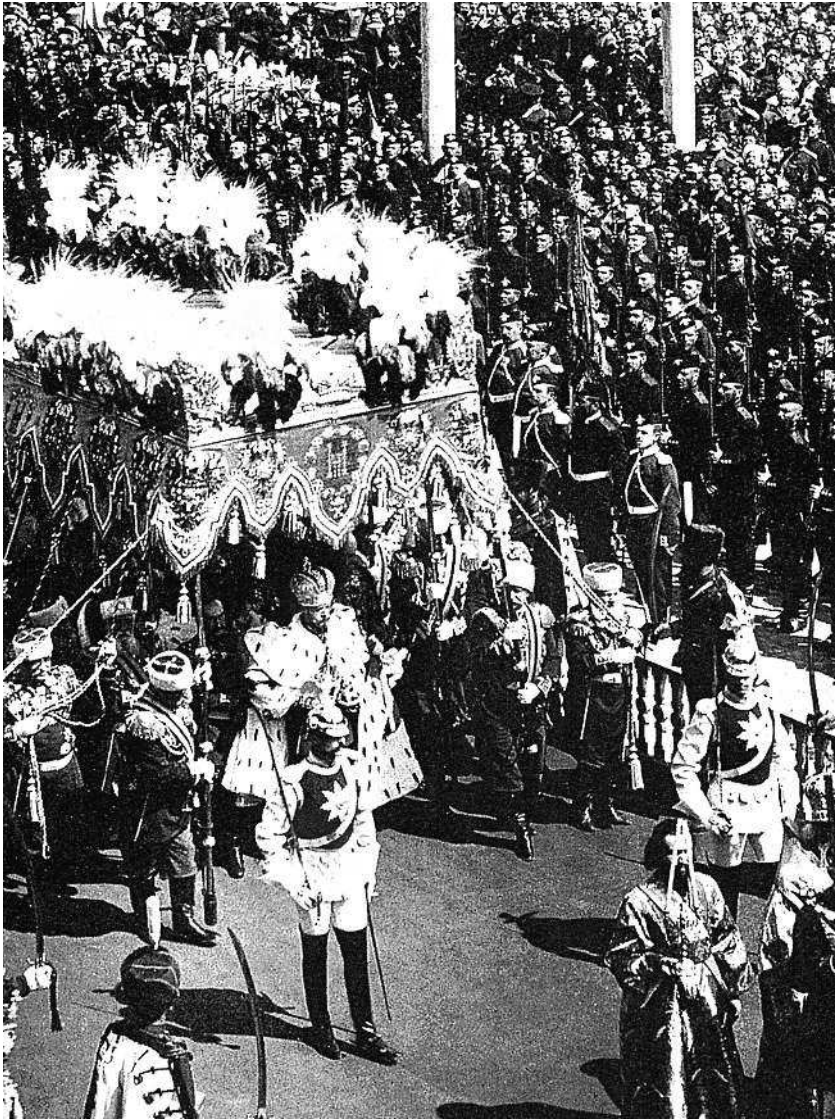
Маннергейм (на первом плане) при коронации Николая Второго 14 мая 1896 года