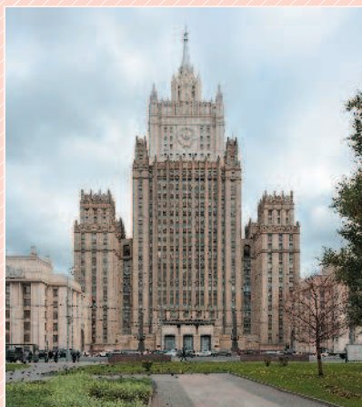
Здание МИД России в Москве

ные программы, направленные на уменьшение экономических рисков и сокращение неравенства. Их противники считают, что правительство не должно играть активную роль в управлении экономикой, и убеждены, что только свобода экономической деятельности, широкое общественное самоуправление, сокращение налогов и управленческого аппарата стимулируют развитие общества и решение его проблем.