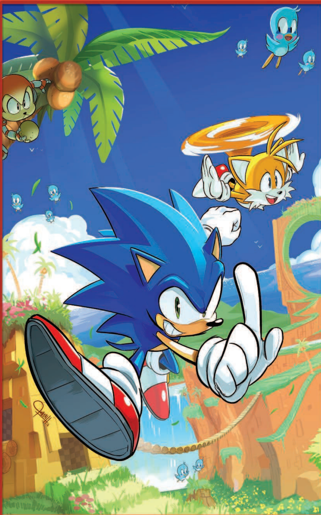
• РИСУНОК - ТАЙСОН ХЕССЕ •