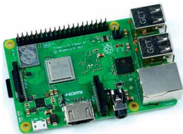
Рис. 1.1. Внешний вид микрокомпьютера Raspberry Pi 3 Model B+

Тем не менее, если у вас еще нет Raspberry Pi, я рекомендую купить Raspberry Pi 3 Model B+. Впрочем, периодически появляются новые модели, и даже если вы купите более позднюю модель, то все равно сможете следовать описаниям из этой книги, поскольку разработчики внимательно следят за обратной совместимостью (то есть новые модели совместимы с более ранними версиями).