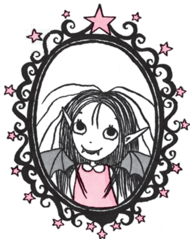
Я! Изадора Мун