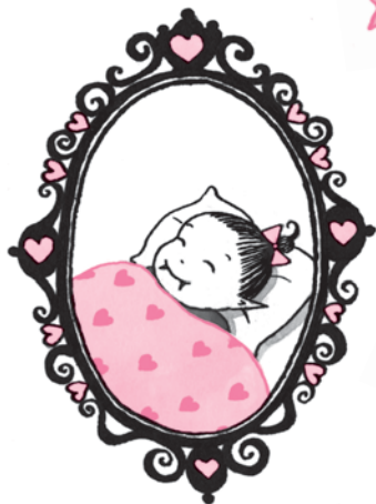
★ Малышка Вишенка ★