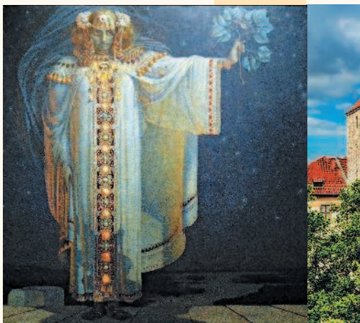
Портрет княгини Либуше, В.К. Мазек, 1893 г.