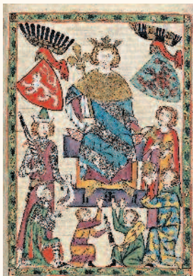
Вацлав II – литография из Манесского кодекса