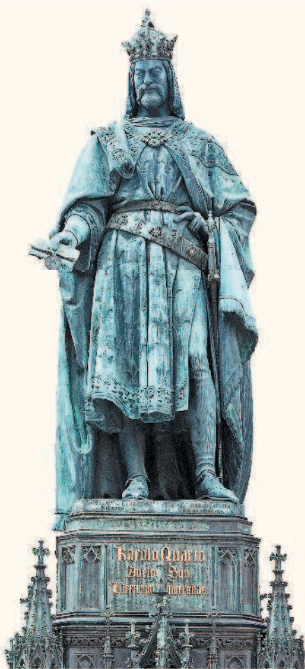
Памятник Карлу IV. Скульптура установлена на площади у Карлова моста

Вершины своей славы Прага достигла в период позднего Средневековья. Главным действующим лицом этого времени можно назвать императора Священной Римской империи и чешского короля Карла IV. Он выбрал Прагу в качестве столицы империи и превратил ее в самый пышный город Европы. Он организовал строительство королевской резиденции в Граде, заложил множество церквей и храмов, поручив работы местным и иностранным архитекторам. В 1344 г. началось строительство собора Святого Вита. Уже существующие городские районы были дополнены еще одним, получившим название Нове Место. Император сам определил его границы и места укреплений, сам заложил первые камни в основание стен. Одна из центральных площадей Нового Города по праву носит имя Карла IV. Тогда же король основал в Пра-