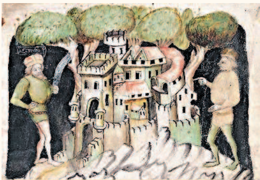
Изображение легендарных Чеха и Леха на фоне Пражского Града, вклеенное в Вудишинский список Чешской хроники в конце XIV в. Чешская хроника дала начало легенде о трех славянских братьях, впервые явив образ праотца Чеха

Легендарная Либуше, предсказав величие и мощь Праги, не ошиблась. Первыми в городе были возведены две крепости: Вышеград и Пражский Град – резиденции чешских королей. Влияние Града в начале XII в. усилилось, а его деревянные строения постепенно заменяли каменными, и