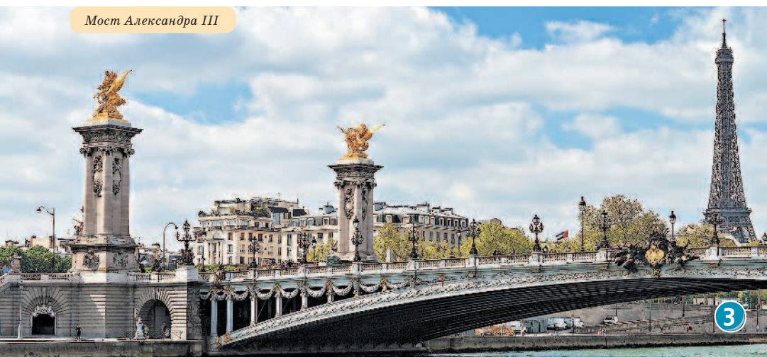
Мост Александра III