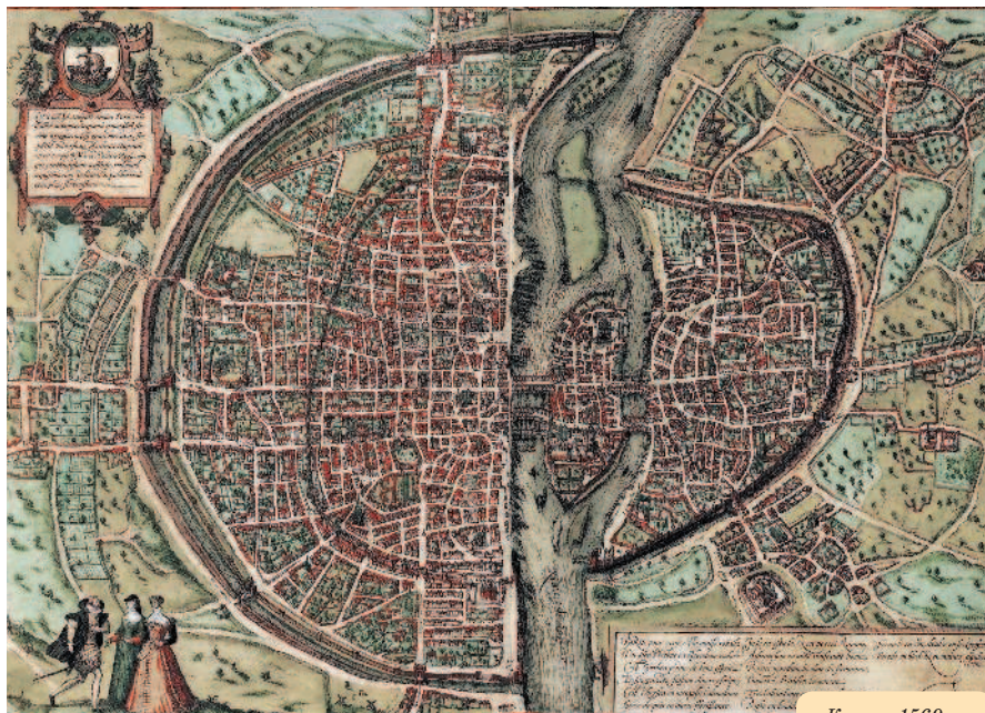
Карта 1569 г.

Предпринятые в середине XIX в. археологические раскопки позволили точно определить границы римского поселения. Его главными осями были современные улицы Сен-Жак и Суффло.