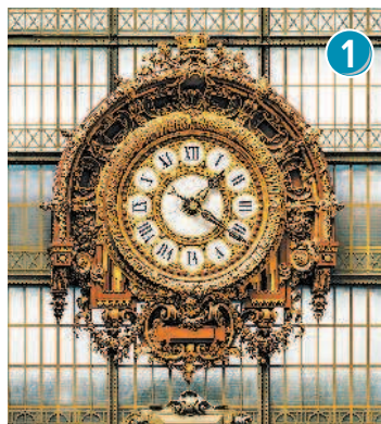
Часы в зале Музея Орсе

На арендованном велосипеде системы Vélib' Стоянка № 7007, по адресу Лилльская ул., 62 (62, rue de Lille).