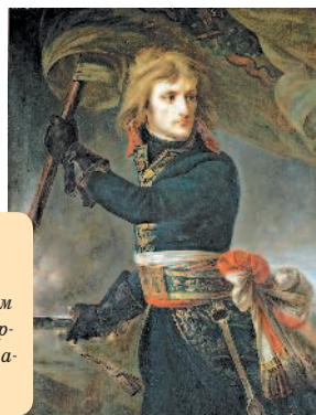
«Наполеон Бонапарт на Аркольском мосту» – картина Антуана-Жана Гро

Людовика XI город постепенно возвращал свой прежний блеск, а парижане вновь обретали вкус к роскоши.