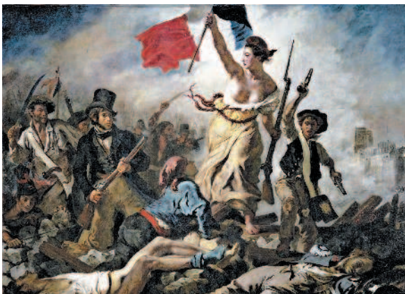
«Свобода, ведущая народ» ( La Liberté guidant le peuple ) – картина французского художника Эжена Делакруа, созданная по мотивам июльской революции 1830 г., положившей конец режиму Реставрации монархии Бурбонов