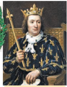
Портрет Карла V

XI в. Париж становится одним из крупнейших европейских центров образования и искусства. В 1257 г. каноник Роберт де Сорбон основал колледж, ставший впоследствии университетом Сорбонна.