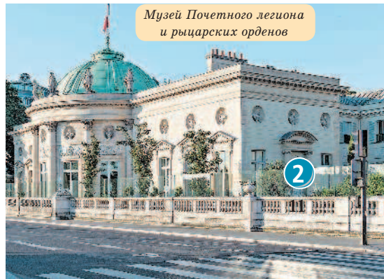
Музей Почетного легиона и рыцарских орденов

Напротив Музея Орсе находится не менее интересный и познавательный 2 Музей Почетного легиона и рыцарских орденов (2, rue de la Légion d'honneur; ☎ ср.–вс. с 13:00 до 18:00, пн. – выходной, вт. – посещение групп. Для групп необходимо предварительное бронирование, посещение с экскурсоводом – 170€, с аудиогидом бесплатно; ✨ legiondhonneur.fr ). Музей расположен в дворцовом комплексе, построенном архитектором Пьером Руссо в 1787 г. Здание предназначалось для городской резиденции семьи Сальмов. Во время Великой французской революции князь Фридрих Сальм был казнен, а сам дворец сначала был конфискован в казну, а затем возвращен кредиторам в уплату огромных долгов покойного. В годы существования Директории дворец был пристанищем для Сальмского клуба, который возглавляла мадам де Сталь.