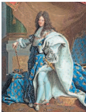
Людовик XIV де Бурбон