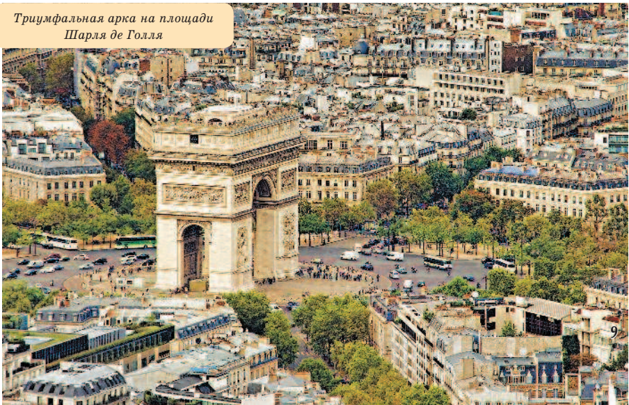
Триумфальная арка на площади Шарля де Голля

Главный политический, экономический и культурный центр Франции и сегодня остается стильным и элегантным. В его архитектурных памятниках запечатлена история, которой дышат узкие улочки старинных кварталов. Открывая Париж квартал за кварталом, вы познакомитесь с более чем 300 его достопримечательностями и совершите путешествие не только в пространстве, но и во времени.