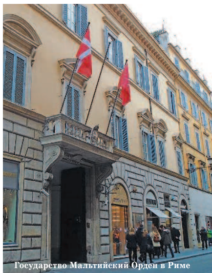
Государство Мальтийский Орден в Риме

Италия — страна с богатейшей историей и культурой, колыбель современной европейской цивилизации, поэтому, чтобы получить максимальные удовольствие и пользу от посещения ее, вам необходимо потратить хотя бы немного времени на предварительную подготовку.