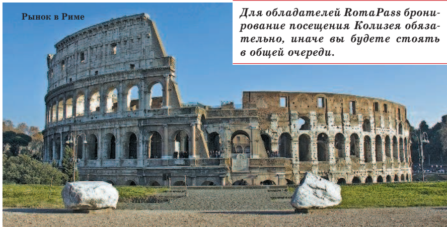
Рынок в Риме

Для обладателей RomaPass бронирование посещения Колизея обязательно, иначе вы будете стоять в общей очереди.