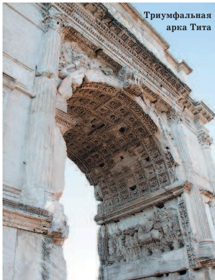
Триумфальная арка Тита

В XIX в. на территории дворцов Августов и Флавиев построили трехэтажную виллу, в которой уже в наше время был открыт Палатинский музей 9 (L'antiquarium del Palatino, Via di San Gregorio, 30). Здесь хранятся находки, обнаруженный в ходе раскопок холма начиная с XVIII в., в том числе знаменитое граффито Алексаменоса — одно из первых изображений спящего Христа.