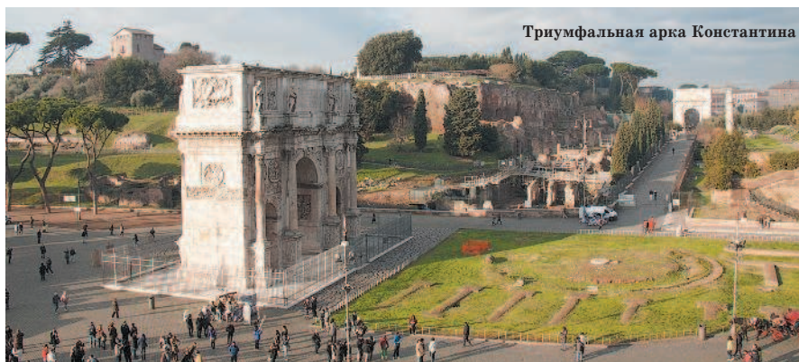
Триумфальная арка Константина

После посещения Колизея, который производит на туристов весьма разное и часто удручающее впечатление, вам наверняка захочется отдохнуть в одном из кафе, которые призывно расположились на террасе на Via Nicola Salvi. Не рекомендуем вам этого делать, поскольку данные заведения умеют удивлять клиентов цифрами в счете.