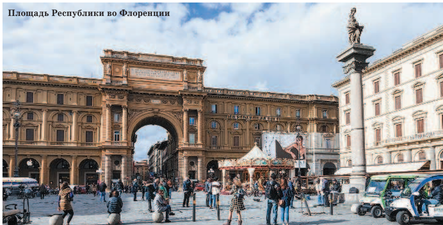
Площадь Республики во Флоренции

Обратите внимание, что в Италии многие учреждения закрываются на сиесту с 12:00–13:00 до 15:00–16:00. И это касается не только государственных структур, но и многих ре-