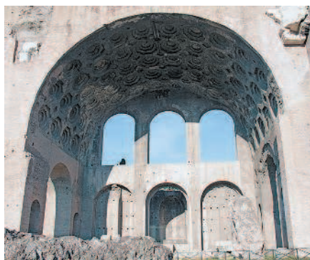
Развалины базилики Максенция и Константина

Триумфальная арка Тита 15 (Arco di Tito, Via Sacra) возведена Домицианом в честь не так давно до этого почившего императора Тита и его победы в Иудейской войне, закончившейся взятием Иерусалима в 70 г. н.э. Обратите внимание на знаменитые барельефы внутри пролета