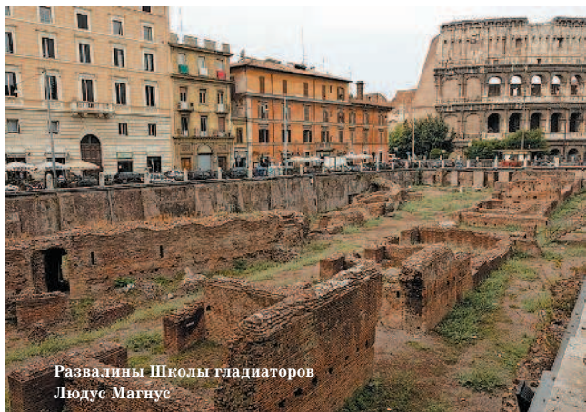
Развалины Школы гладиаторов Людус Магнус

которые историки считают, что Константин Великий не стал строить свою собственную новую арку, а просто переделал более раннюю чужую, возведенную еще Адрианом. Сооружение было украшено скульптурными элементами, которые сняли с других строений, а те, которые изготовили сами, ярко свидетельствуют об упадке, который наступил в умирающем античном искусстве к началу IV в. Более того, если прежние императоры строили триумфальные арки в честь славных побед над внешними врагами, то Константин соорудил ее в честь победы над врагом внутренним — он разгромил своего соперника Максенция в битве у Мульвийского моста на Фламиниевой дороге.