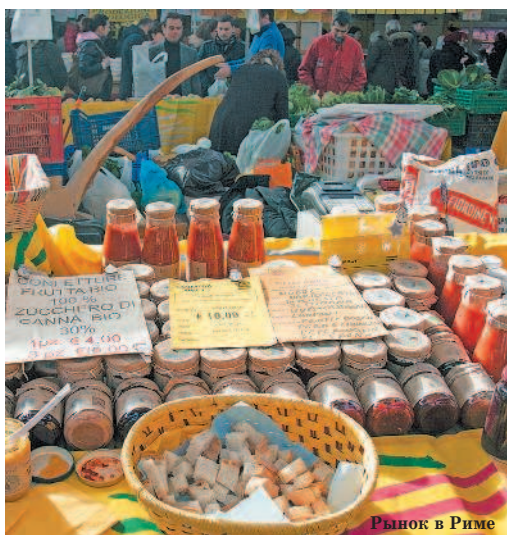
Рынок в Риме

Если вы хотите поселиться не в центре, то лучше всего выбирать такое место, чтобы рядом была станция метро. Летом в сильную жару можно рассмотреть вариант на берегу моря в Остии, городская электричка оттуда до центра Рима идет менее получаса.