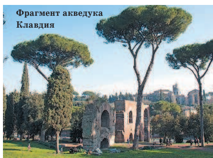
Фрагмент акведука Клавдия

Теперь вернемся немного назад, пройдем через ворота и поднимемся на Палатинский холм. Прогулка по Палатину и форуму займет у вас минимум 2 часа. На этой территории негде купить воды или перекусить, а на форуме сложно укрыться от солнца,