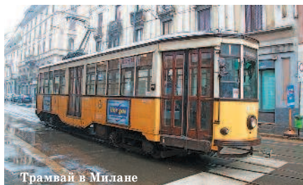
Трамвай в Милане

Рекомендуем посетить официальный сайт министерства по туризму Италии (русская версия: www.italia.it ) . Подобные сайты есть у каждого итальянского региона и крупного города.