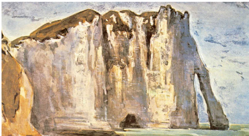
[Рис. б] Эжен Делакруа. Утес в Этрета. 1849. Голубая бумага, уголь, гуашь. 14,5 × 24 см. Музей Бойманса — ван Бёнингена, Роттердам, Нидерланды