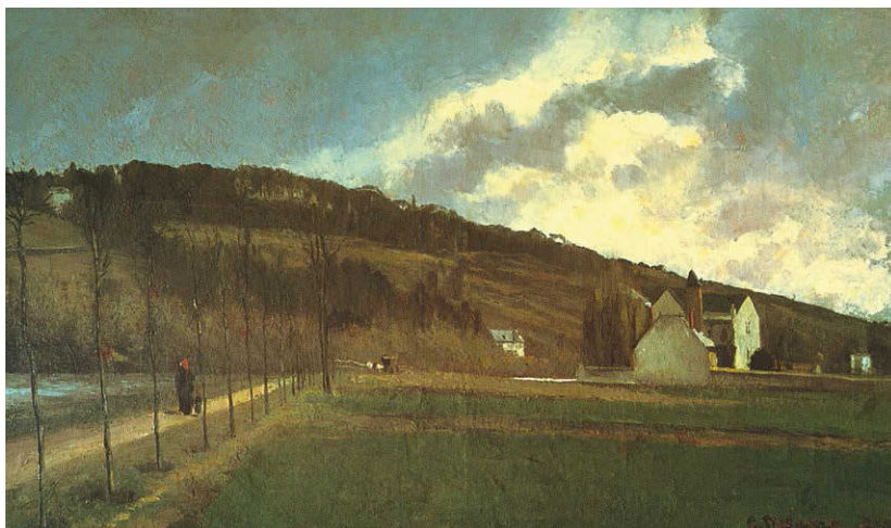
[Рис. а] Камиль Писсарро. Берега Марны зимой . 1866. Холст, масло. 91,8 × 150,2 см. Чикагский институт искусств, США