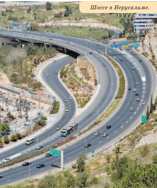
Шоссе в Иерусалиме.

Рельеф Израиля довольно разнообразен. На западе страны, вдоль побережья Средиземного моря, тянется плодородная Прибрежная равнина. Северо-восток Израиля занимают Голанские высоты, восток – горные цепи Галилеи и Самарии, а также впадины Иорданской долины и Мертвого моря. На юге Израиля находятся пустыни Негев и Арава. Самая высокая точка страны – гора Хермон (2224 м) на