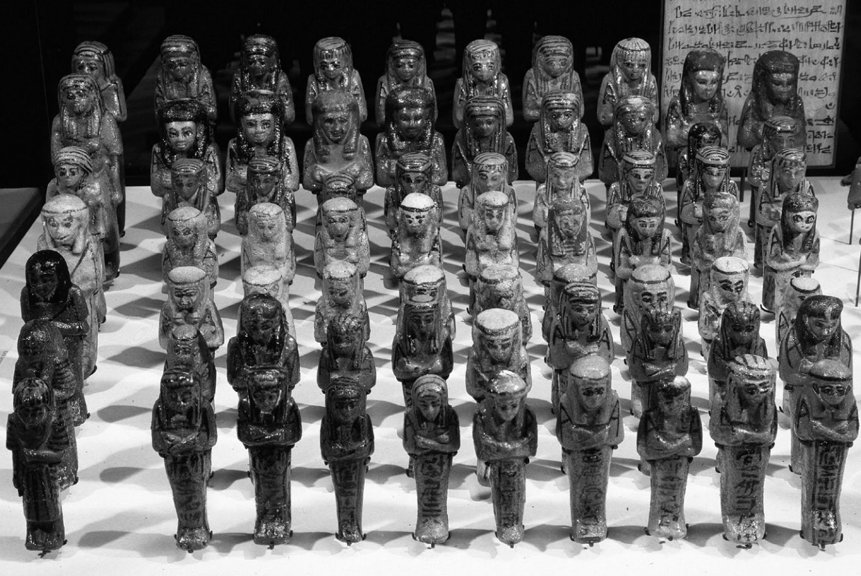
Несколько ушебти из гробницы Третьего переходного периода. Во главе каждой группы рабочих стоит десятник

в деревянный гроб, а иногда в несколько гробов, вставленных друг в друга. Мумии богатых египтян хоронили в каменных саркофагах.