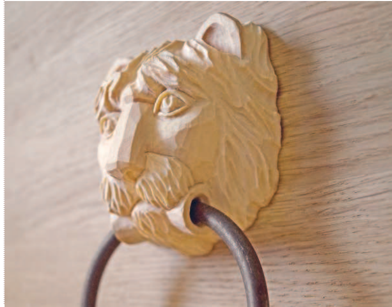
Дверной молоток. Барельеф. 2012 г.