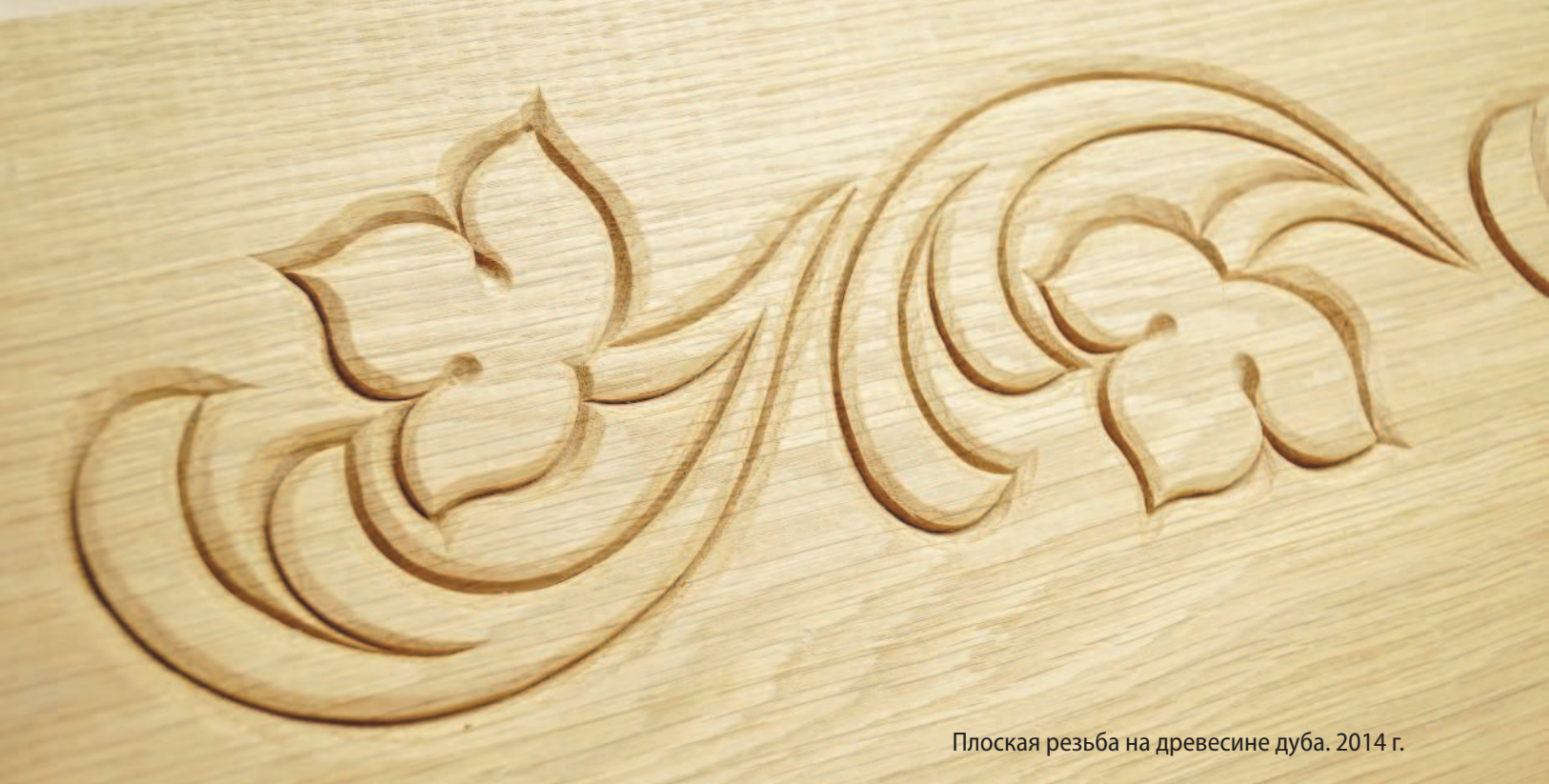
Плоская резьба на древесине дуба. 2014 г.