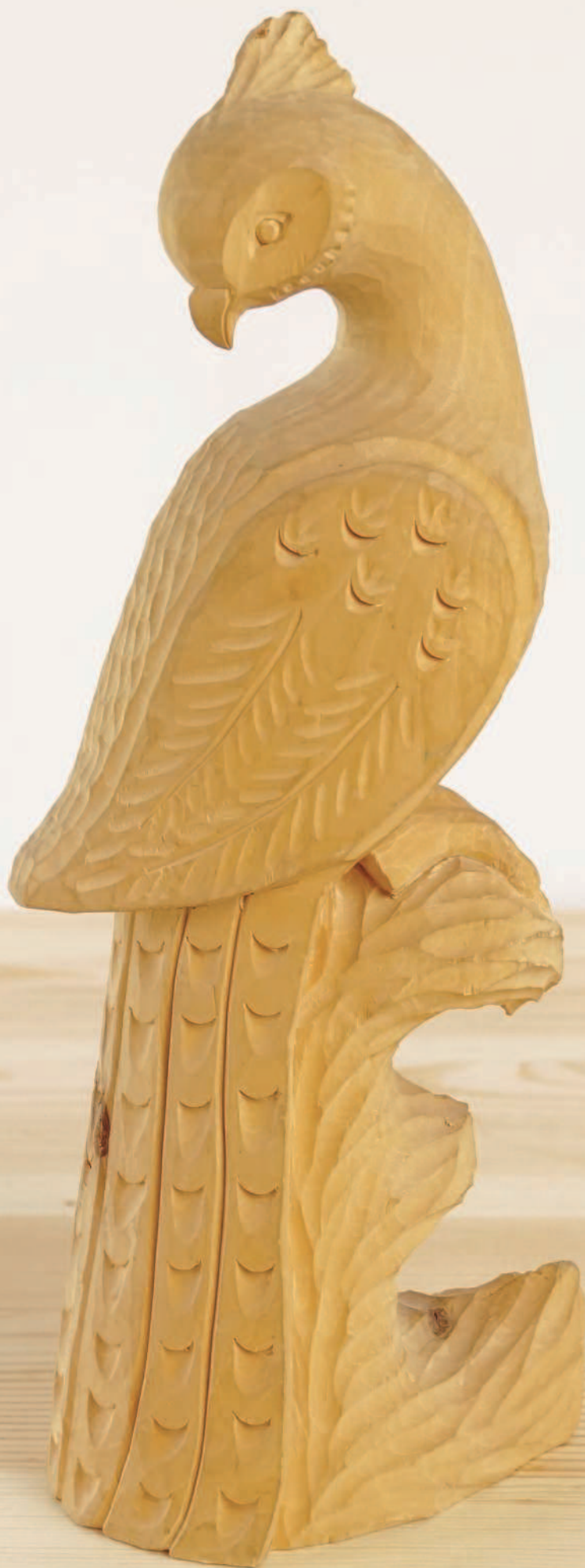
Богородская скульптура-игрушка (копия). 1995 г.