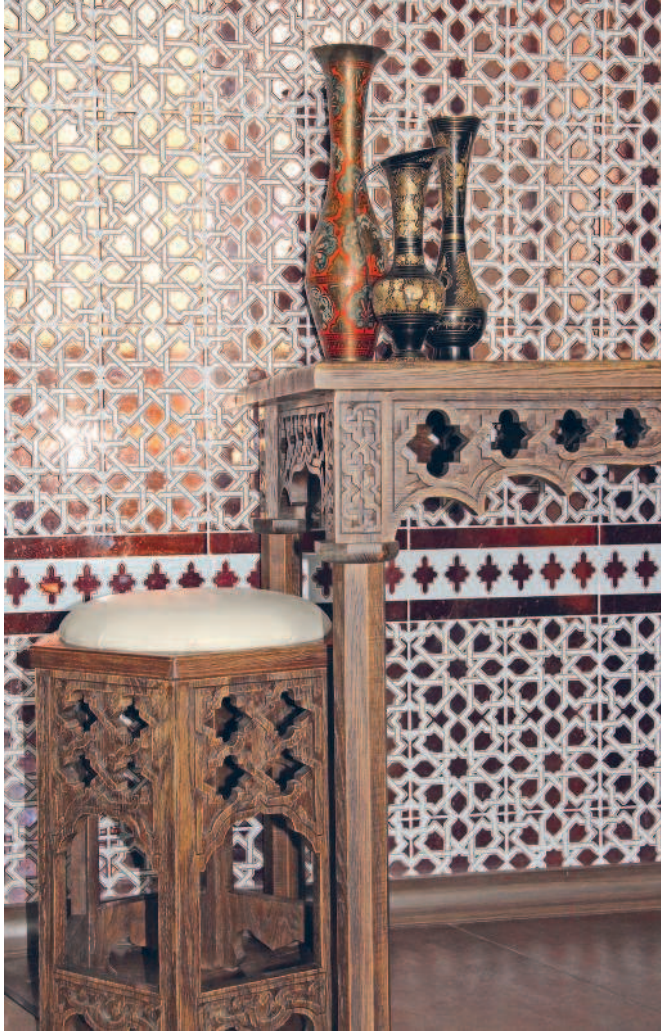
Мебель по мотивам искусства Марокко. Плоскоре- льефная и прорезная резьба частей стола и табурета. 2012–2014 гг.