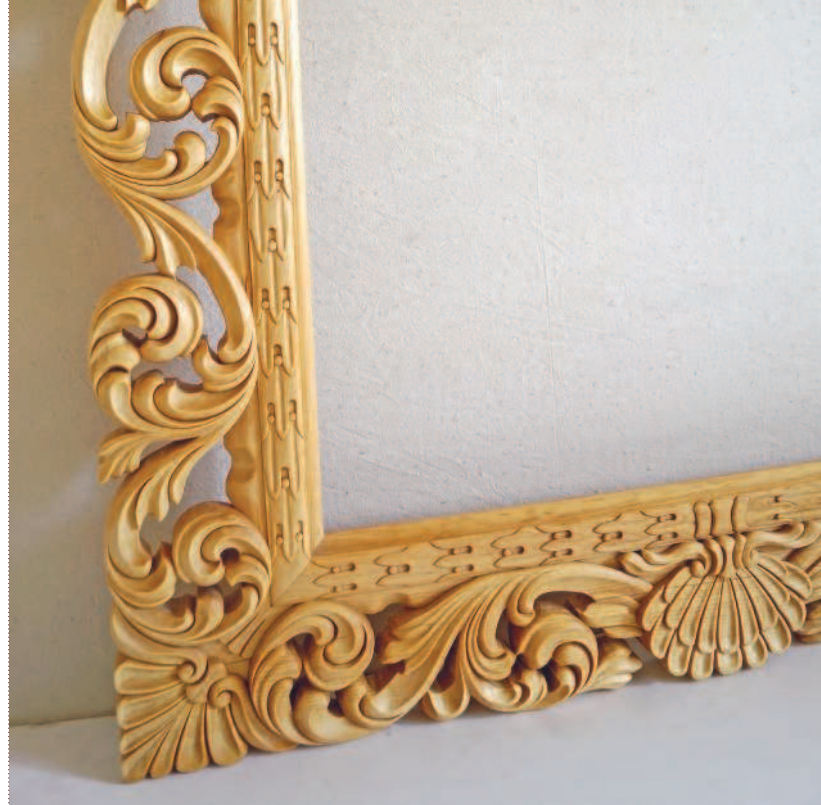
Рама для зеркала. Рельефная прорезная резьба. 2015 г.