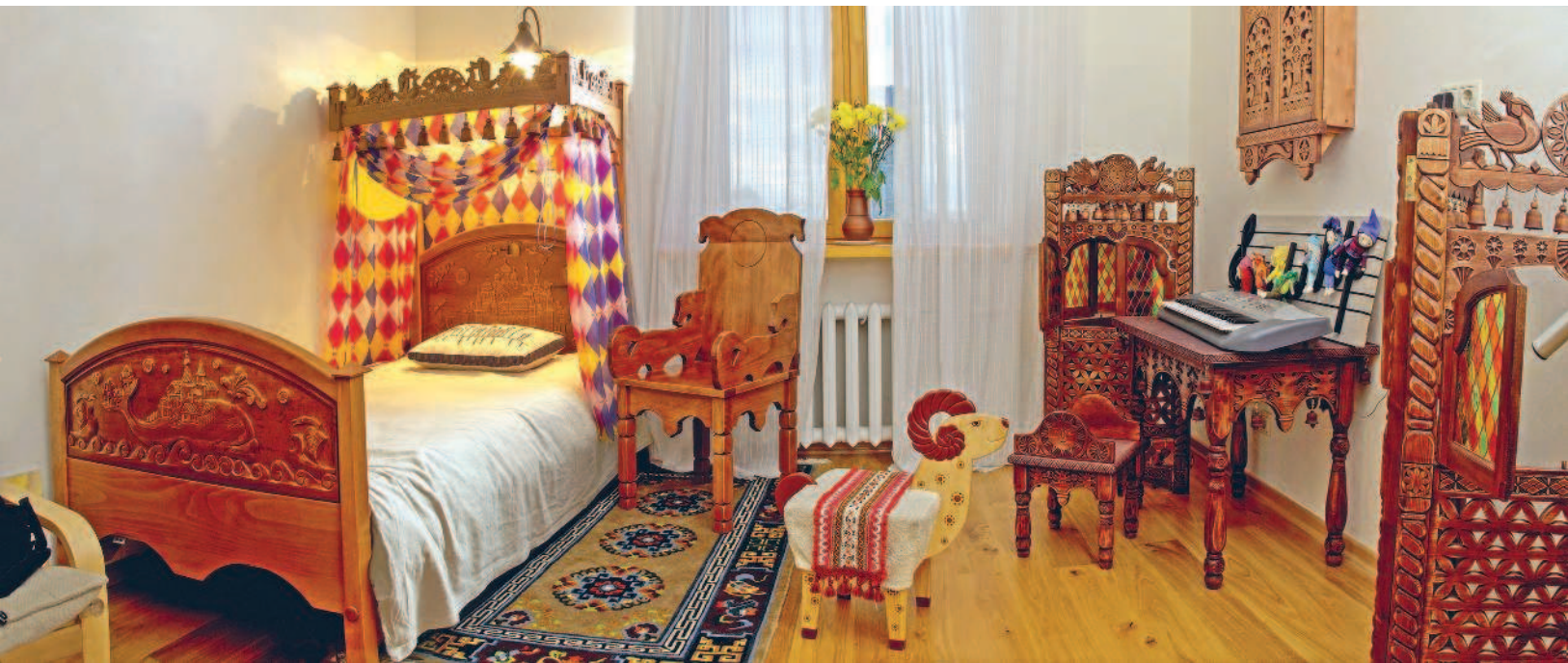
Детская комната. Мебель декорирована разными видами резьбы. 2008–2009 гг.