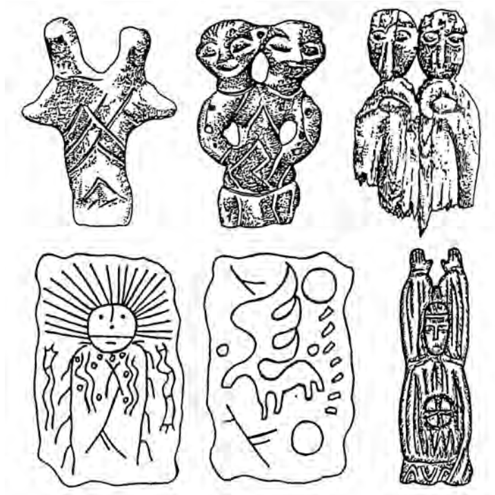
Рис. 1. Ритуальные изображения Матери Прародительницы, Солнца, Небесного Оленя и Встречающего Солнце.

Отличительной особенностью архаичных форм шаманизма от других эзотерических, философских, религиозных и мистических доктрин является отсутствие четких границ между добром и злом, божественным и демоническим, созиданием и разрушением. В мире шаманских представлений полярные понятия взаимно дополняют друг друга, гармонично сосуществуя в виде целостности.