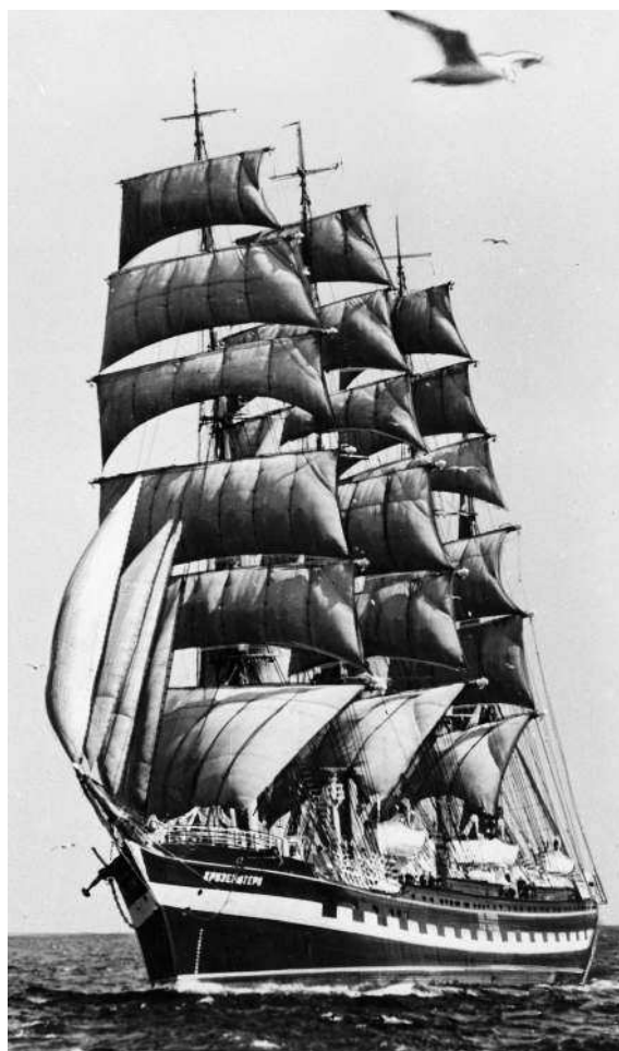
Современный парусник «Крузенштерн» совершил несколько кругосветных путешествий

Кроме экипажа на «Надежде» разместилось посольство под руководством Николая Резанова, чьей миссией было установление торговых отношений с Японией. Единственными иностранцами, приглашенными принять участие в путешествии, стали врач