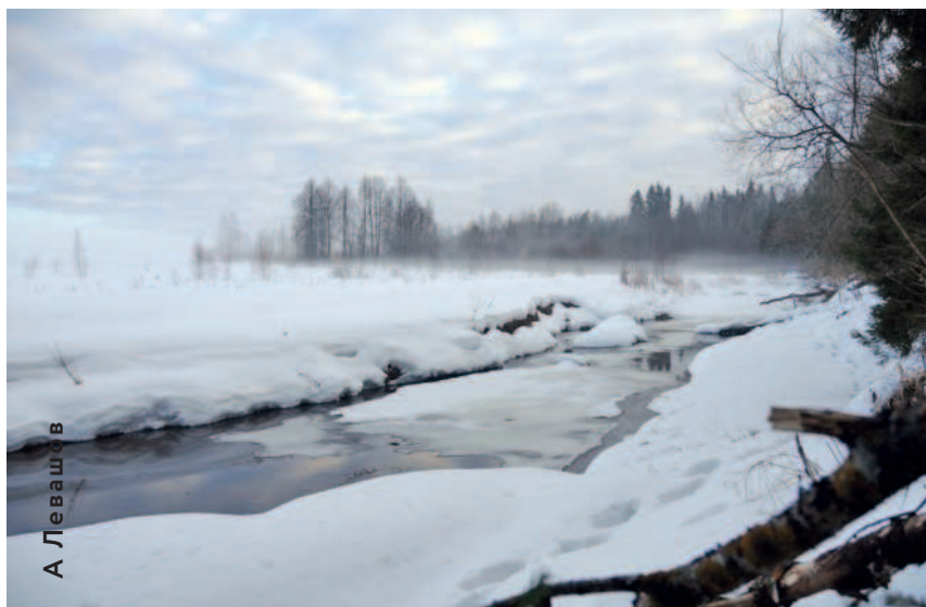
◁ На излучине

Кажется, наладилась ясные дни, и солнце старается днем изо всех сил, подтапливая все новые пласты снега, а к вечеру стелется полосой зыбкий холодный туман, пряча все совершенные солнцем за день перемены.