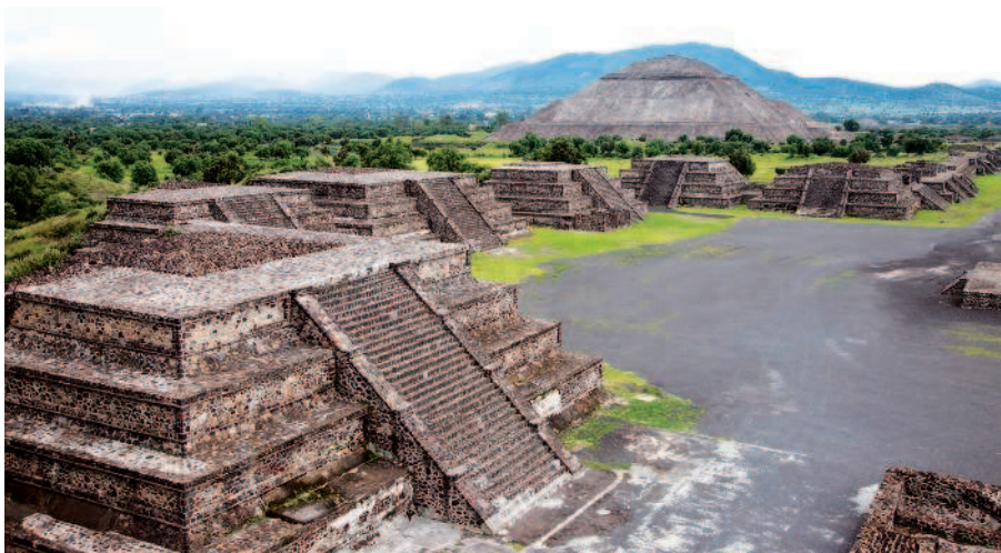
Археологический комплекс Теотиуакан, Мексика, ок. 200-х гг. до н.э.