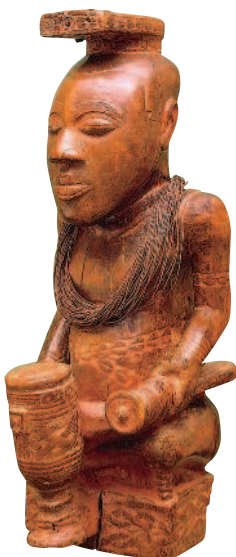
«Статуэтка вождя племени бакуба, Ката Мбула», природные материалы, Демократическая Республика Конго, начало XIX в.

6 СТАТУЯ ВОЖДЯ племени КУБА (бакуба), носившего имя Ката Мбула, высотой 51 см хранится в Королевском музее Центральной Африки в бельгийском городе Тервюрен. Образ Мбулы, чье правление пришлось на начало XIX века, идеализирован и окружен атрибутами монархической власти (там-там, драгоценности из царской сокровищницы). После смерти государя задача состояла в том, чтобы передать его мощь преемнику посредством такой деревянной фигурки.