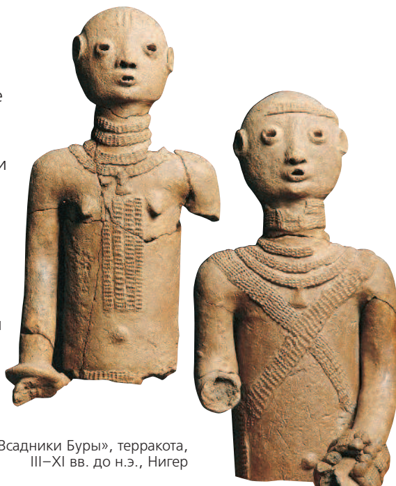
«Всадники Буры», терракота, III–XI вв. до н.э., Нигер

1 «ВСАДНИКИ БУРЫ», две терракотовые статуэтки, были найдены в долине Нигера, в чашеобразном углублении рельефа диаметром около 1 км. С 1975 года там велись раскопки, открывшие многие некрополи, в которых сохранились богатые гробницы с погребальными урнами. Внутри статуэток была помещена голова, проткнутая стрелой.