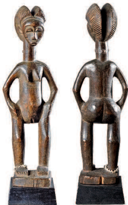
«Статуэтка Бауле», дерево, Кот Д'Ивуар

7 Статуэтка « ЖЕНСКАЯ ФИГУРА С КУБКОВ » держит перед собой сосуд из тыквы, наполненный священным каолином. Выполненная так называемым «Мастером из Були», скульптором Хемба XIX века, эта коленапреклоненная фигурка обеспечивает связь между главой общины и окружающим миром. В ее лице невозможно разглядеть ничего, кроме глубокой погруженности в себя.