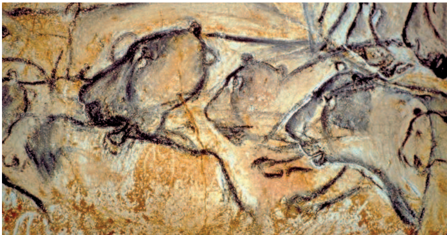
Львы из пещеры Шове

3 Наскальные рисунки известнейшей французской ПЕЩЕРЫ ЛАСКО (Ляско) датируются 15 000 лет до н.э. Найденная 12 сентября 1940 года, пещера открывается залом быков, где три группы лошадей, быков и оленей изображены в сказочном танце, динамичном хороводе.