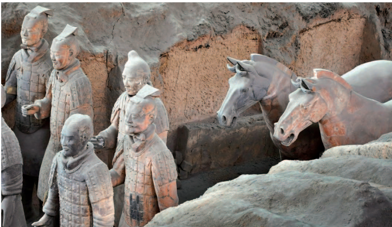
«Терракотовая армия Цинь Шихуанди», 246 г. до н.э.