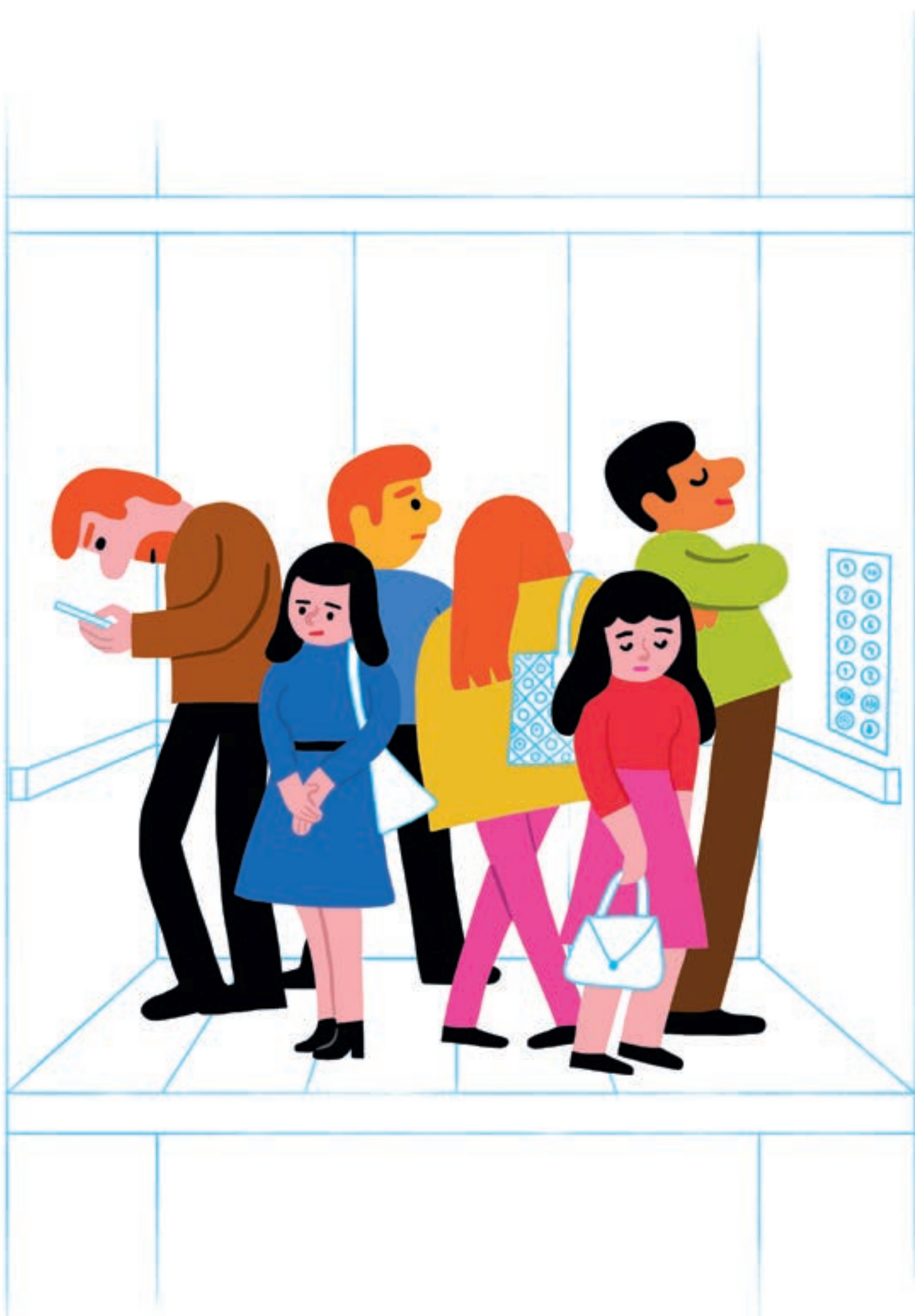
Шесть человек в лифте. Один из них боится что-то упустить. Двое чувствуют себя одинокими.