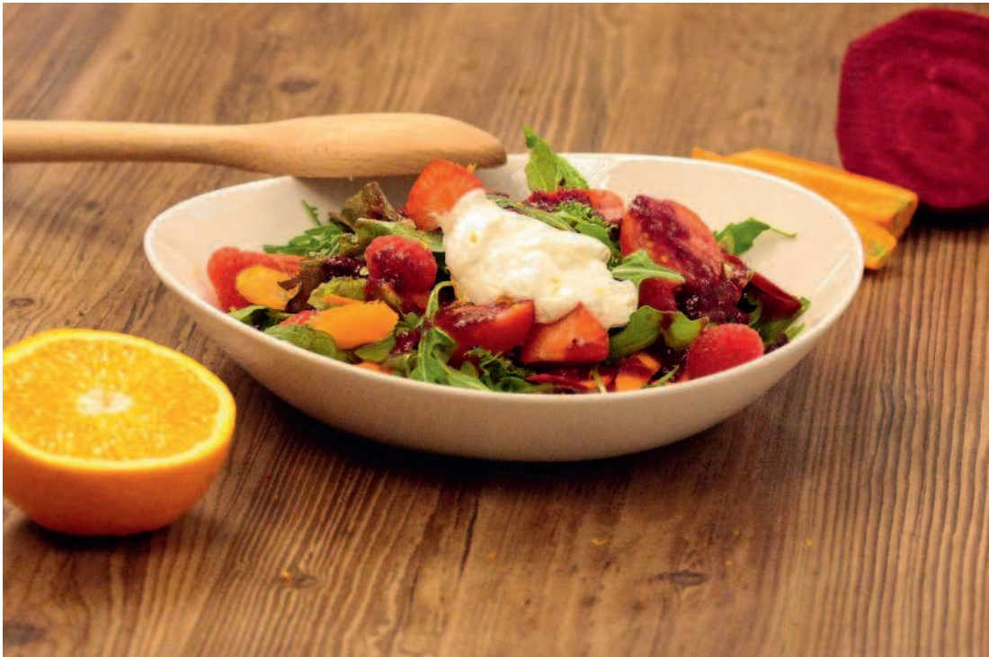
Овощной салат с двумя заправками