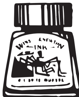
тушь Winsor & Newton