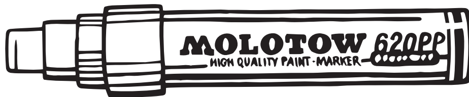
маркер с плоским концом Molotov