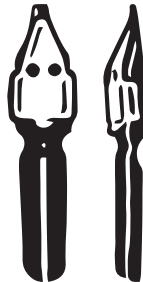
плоское перо с накопителем для туши снизу