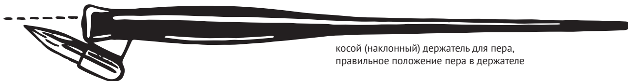
косой (наклонный) держатель для пера, правильное положение пера в держателе