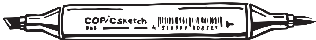
двусторонний маркер Copic Sketch