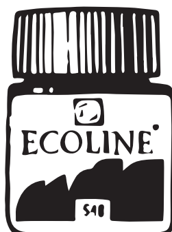
жидкая акварель Ecoline