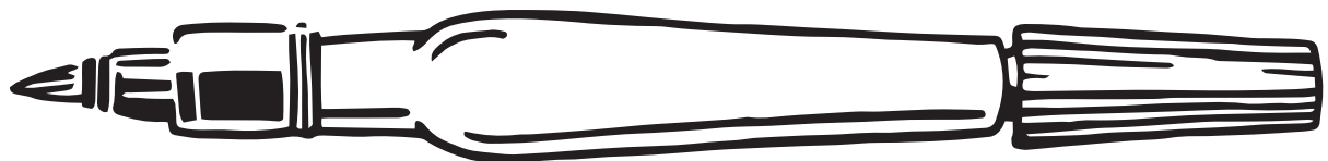
Pentel Aqua Brush