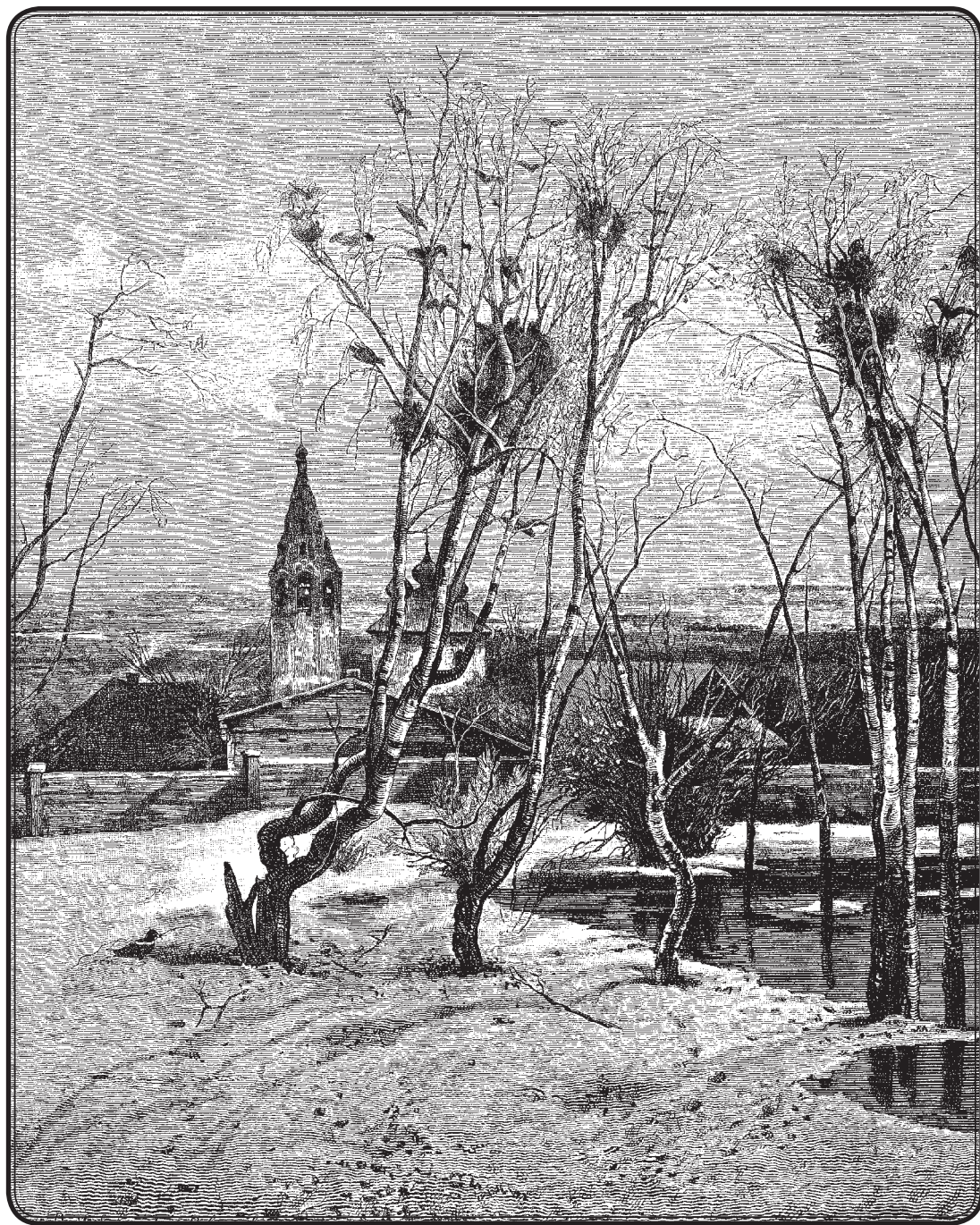
Саврасов А. К. Грачи прилетели. 1873 г.