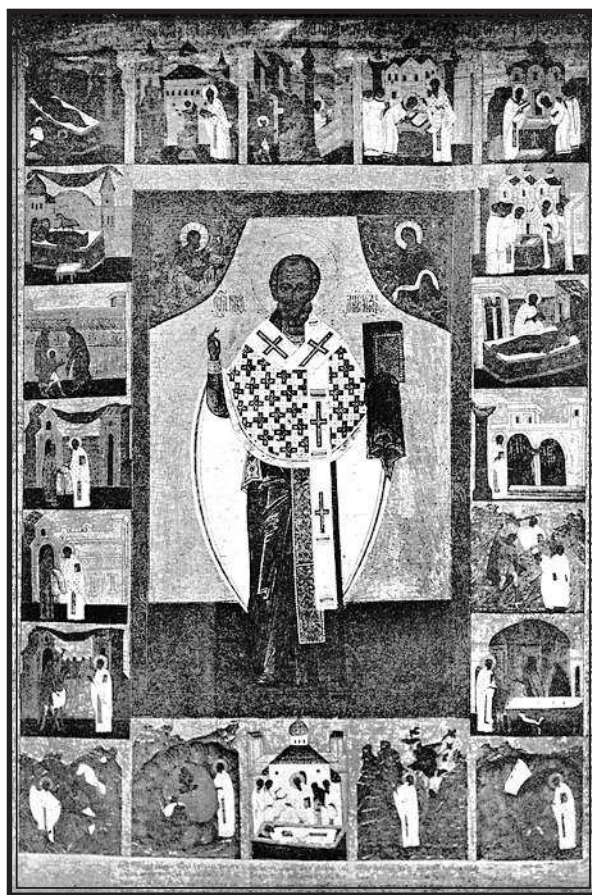
Житие св. Николая Чудотворца. Новгородская школа XVI в.

старинной иконой. Но даже здесь лишь очень немногие любители и собиратели имеют понятие о том, что такое старинная икона на самом деле. Нет ничего более ошибочного, например, чем как раз самое распространенное в нашем обществе мнение о «темных» старинных иконах. В надлежащих условиях художественные древние иконы можно видеть лишь в собраниях любителей. Только эти расчищенные и приведенные в первоначальный вид произведения и могут служить предметом исследования. Весь прочий материал надо, во избежание ошибок, оставить пока в стороне.