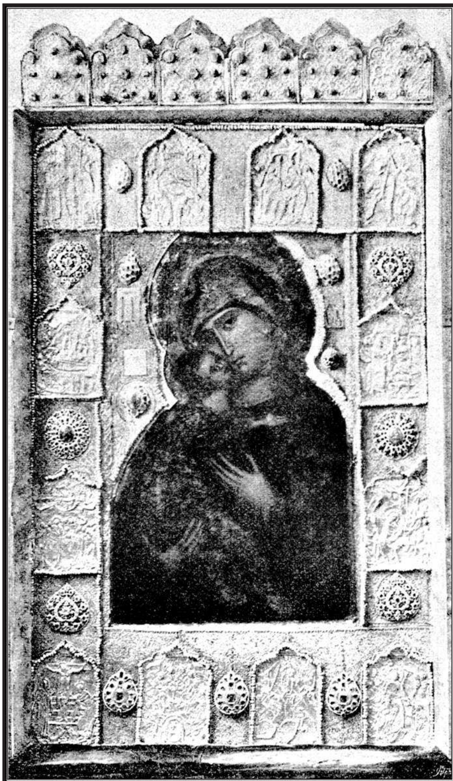
Икона Владимирской Богоматери