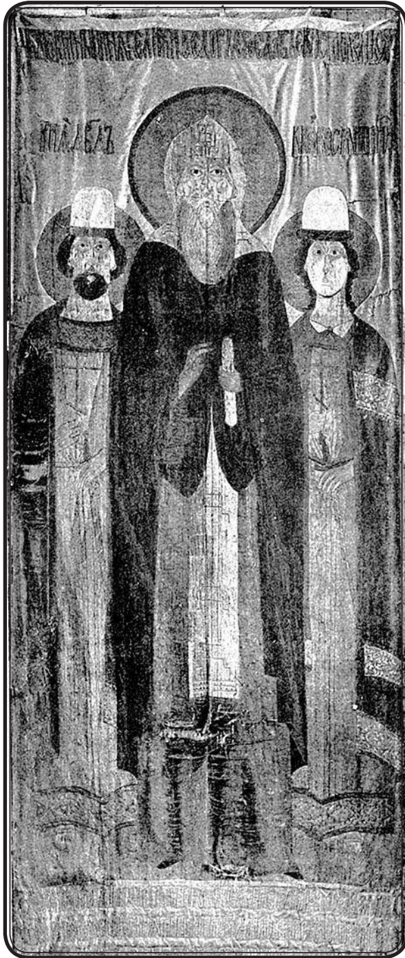
Св. Ярославские князья Федор, Давид и Константин. Шитье XVI в.

роль «главного» и частных, к которым могут быть отнесены одежды, вводные предметы, архитектура и пейзаж. Еще более важны для стили-