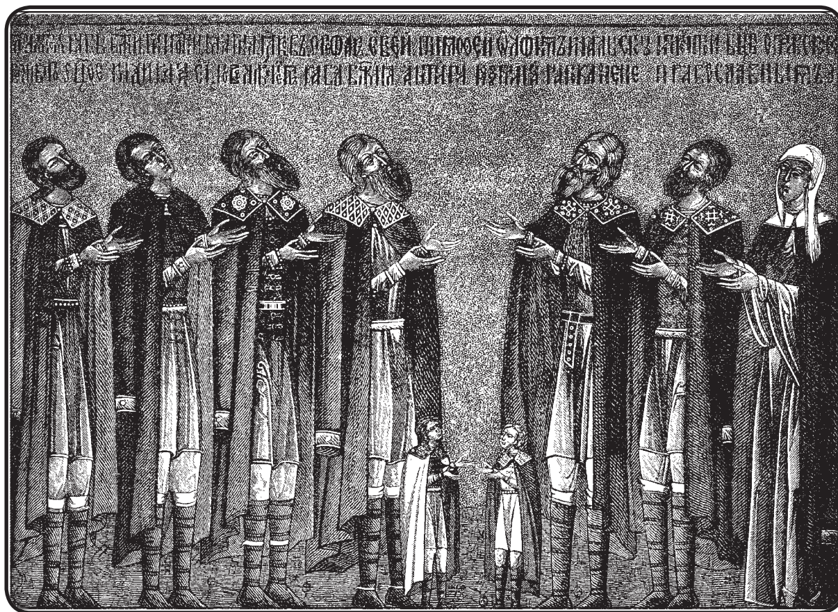
Икона Новгородского семейства

пейзаж итало-греческой иконы XV в., если сравнить его с условным архитектурным пейзажем русской иконы того же времени. Но, исследуя всю группу памятников, мы убедимся, что именно этот привлекательный пейзаж является одним из признаков бесстильности и провинциальности итало-греческой живописи XV в., тогда как архитектурный пейзаж русской иконы служит свидетельством ее чистого и строгого стиля. Подобными же примерами можно было бы объяснить то непонимание высоких художественных качеств Новгородской школы XIV — XV вв., которое было проявлено почти всеми русскими исследователями. Они судили о древней русской живописи, имея всегда перед глазами высшие типы совершенно иной художественной группы — живописи современной академической или хотя бы живописи европейского Возрождения. Высшим моментом в русской иконописи им казалась поэтому наиболее затронутая западными влияниями Московская царская школа конца XVII в. При таком взгляде предполагалось, что русская иконопись впервые осуществила именно в эту эпоху свои лучшие стремления, на достижение которых раньше у нее не было сил и способностей. На самом деле, у более древних групп и школ русской живописи были совершенно иные художественные стремления и задачи, которые и были выполнены ими в свое время самым блестящим образом.