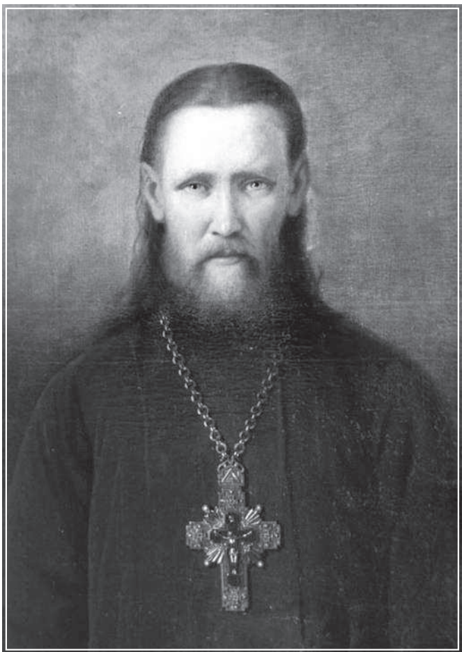
М. В. Брянский. Портрет святого праведного Иоанна Кронштадтского. 1891