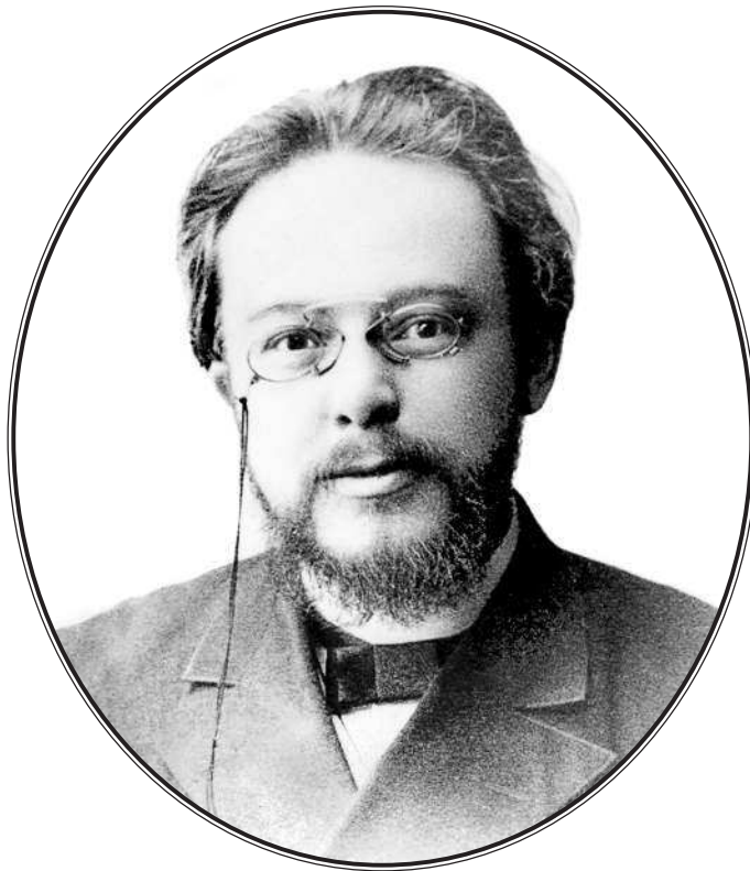
Александр Александрович КОРНИЛОВ (18(30)11.1862 — 26.04.1925)

Русский писатель, публицист, политический и общественный деятель, специалист по русской истории XIX в.