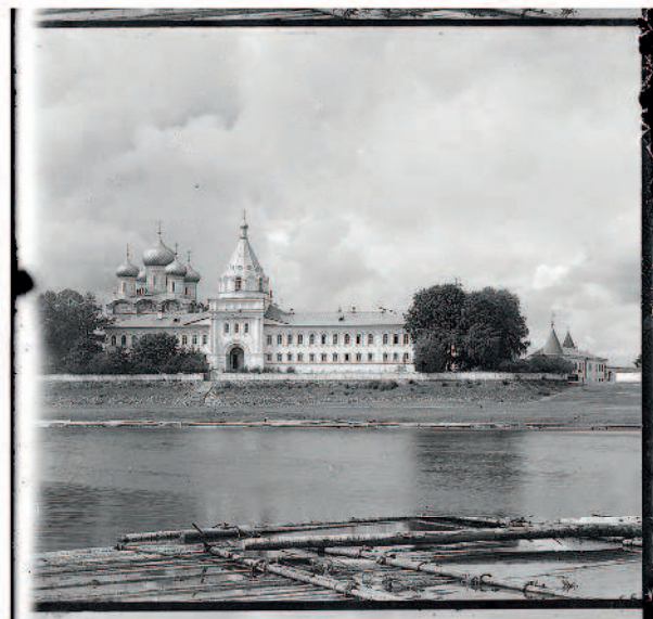
Водяные врата и Архиерейские покои. Ипатьевский монастырь. Вход в монастырь со стороны реки Костромы. Кострома.